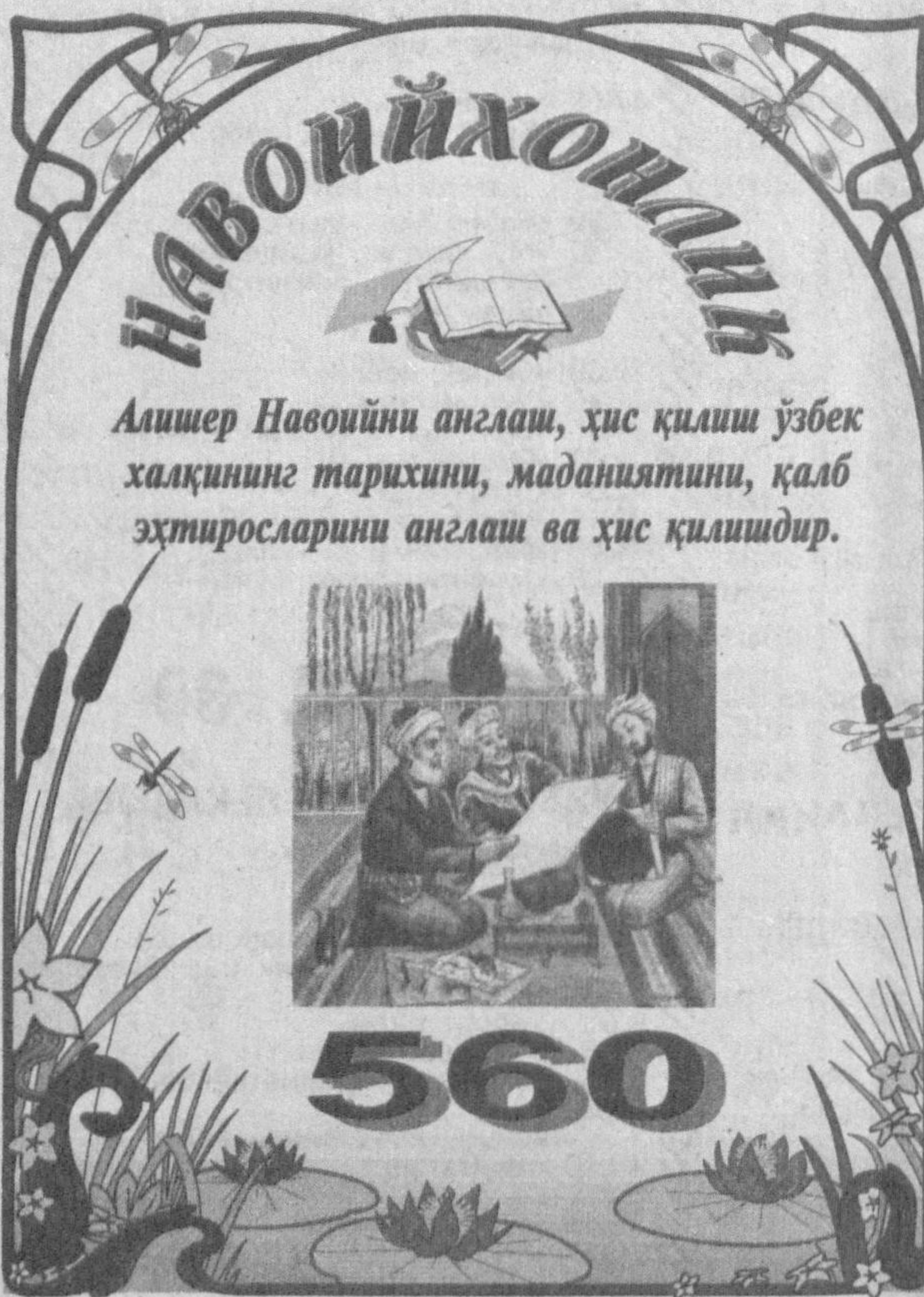
Алишер Навоийни англаш, ҳис қилиш ўзбек халқининг тарихини, маданиятини, қалб эҳтиросларини англаш ва ҳис қилишдир.

Қошинг ҳажрида ҳар наълики кийсам, Келур пайваста, жоно, шакли мөхроб. Наъл — тақа. Наъл — қавуш. Бу ерда тилга олинган наъл, гўё махсус бир қавуш. Махсуслиги шундаки, у ҳижрон кий-