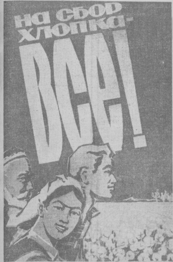
Паннат художников Б. АББАКУМОВА и В. ЕВЕНКО. (Издательство «Узбекистан»).