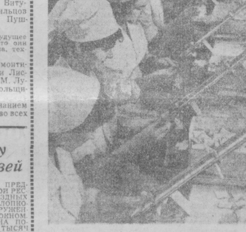
Конвейер Ташкентского химико-фармацевтического завода. Одновременно двадцать рабочих фасуют самые разнообразные лекарства.

По периметру здания пропущен антисейсмический пояс. Студенты — народ допытливый, они несколько раз обогнали дом, осматривали комнаты, но так и не увидели под