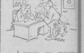
— А почему вас интересуют эти иди и меня вакцина прошибает?