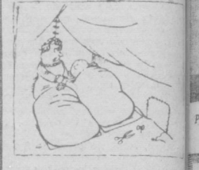
— Ты куда это ночью ходишь?