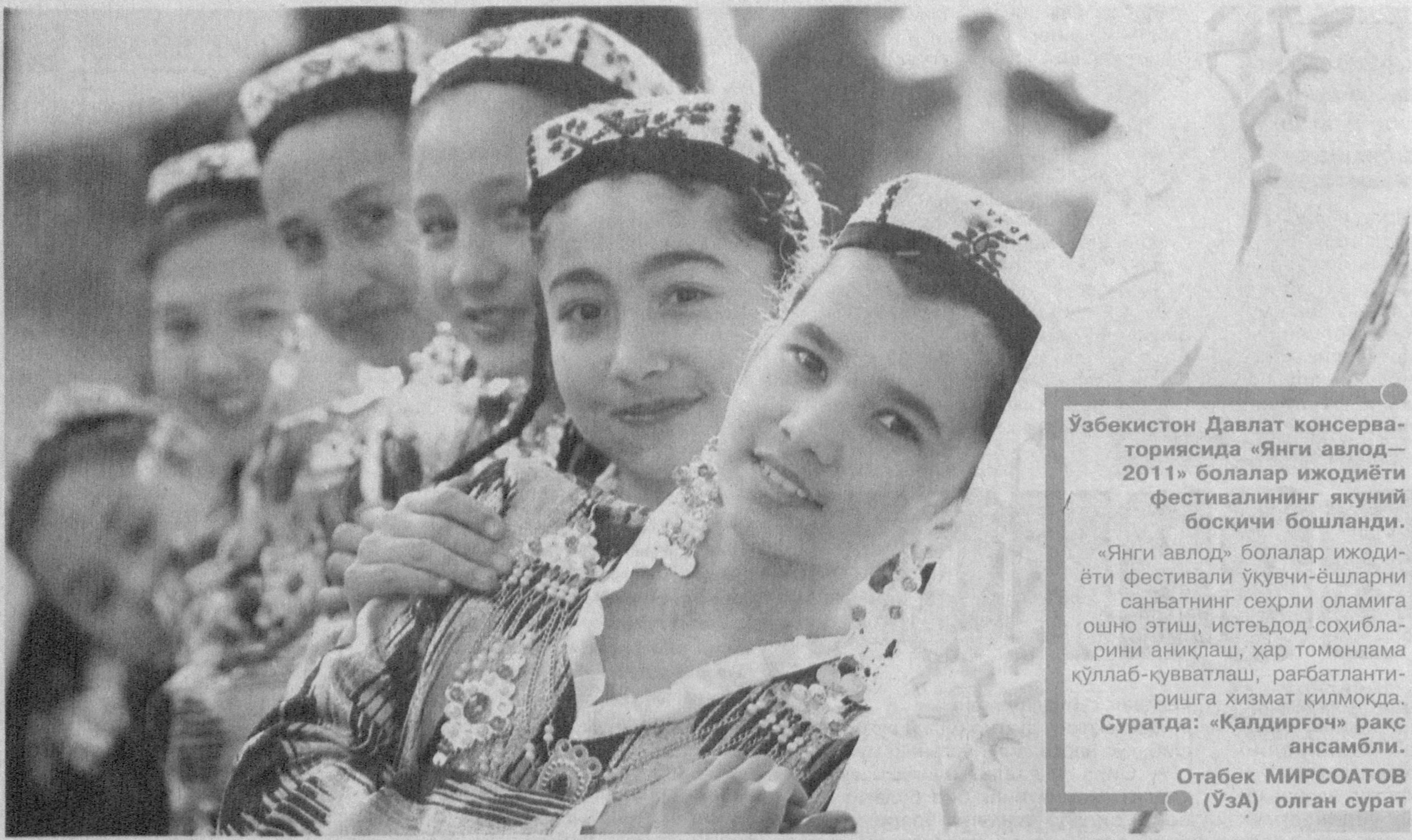
Ўзбекистон Давлат консерваториясида «Янги авлод—2011» болалар ижодиёти фестивалининг якуний босқичи бошланди. «Янги авлод» болалар ижодиёти фестивали ўқувчи-ёшларни санъатнинг сеҳрли оламига ошно этиш, истеъдод соҳибларини аниқлаш, ҳар томонлама қўллаб-қувватлаш, рағбатлантиришга хизмат қилмоқда. Суратда: «Қалдирғоч» ракс ансамбли.