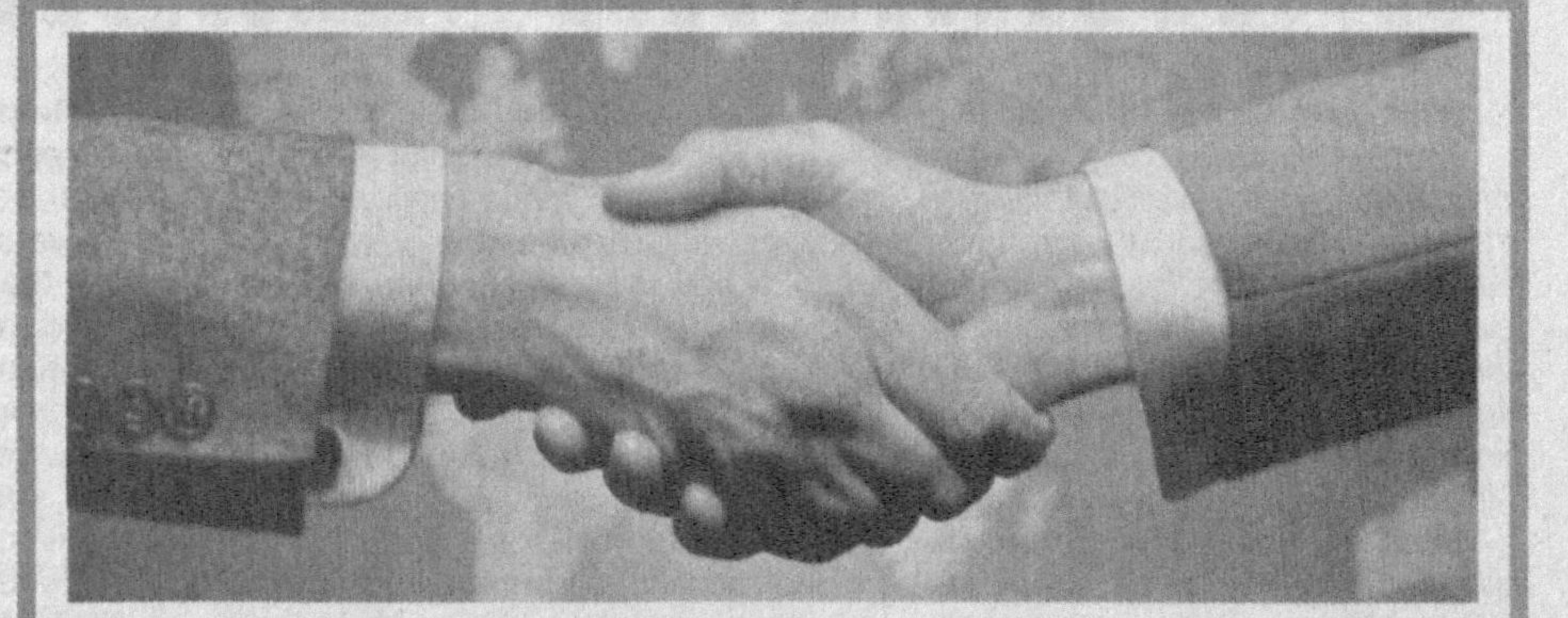
Мустаҳкам ижтимоий ҳамкорликдан кучли ижтимоий ҳимояга

Жамоат бирлашмалари орасида касба уюшмалари алоҳида мавқега эга. Бу уларнинг оммавийлиги, кенг қамровли ташкилий тузилмаси, аксарият корхоналарда бошланғич ташкилотлари мавжудлигида кўринади.