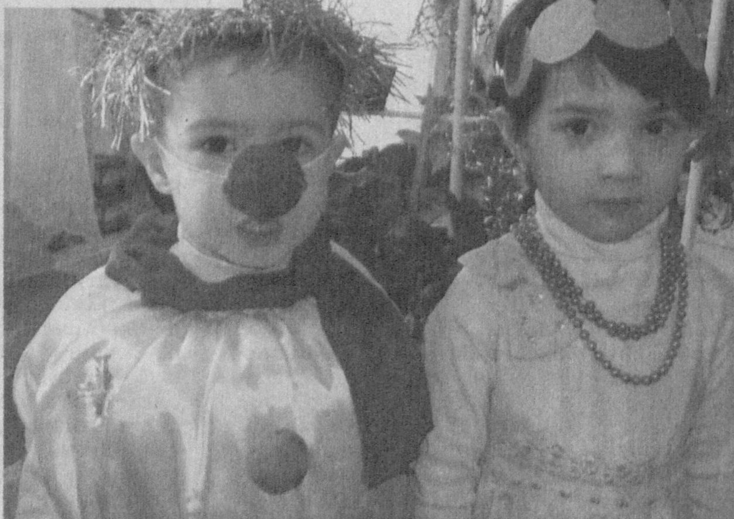
Инсон умрини тўрт фаслга менгайдиган бўлсак, унинг қаймоғи болаликдир. «Фарзандинг билан беш ёшгача шох билан каби муомалада бўл...» дейилади қадимги Ҳиндистон хикматларида. Шу сабаб, болалик фаслидаги ҳар қандай шўхлик ва эркалик катталар томонидан кечирилади.