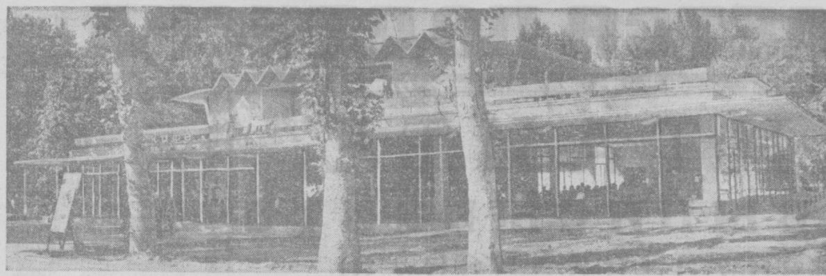
В Ферране открылось молодежное кафе «Юности». Расположенное на двух этажах, оно может одновременно принять 550 посетителей. Отлично поработали строители СМУ-11 стратреста № 14: они на месяц раньше срока сдали сооружение в эксплуатацию.

В заключение на совещании-семинаре выступил кандидат в члены Политбюро ЦК КПСС, секретарь ЦК КПСС П. Н. Демичев.