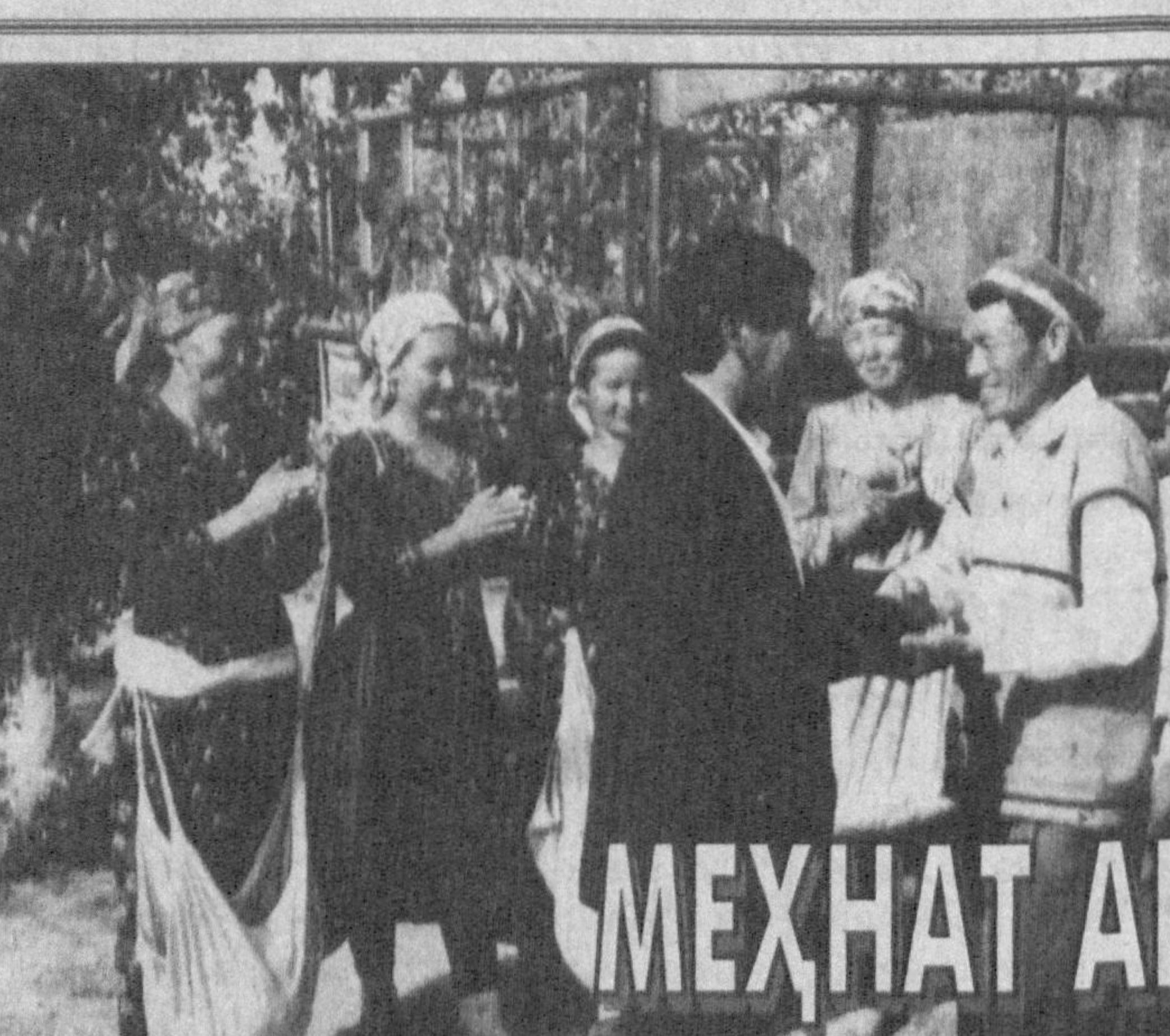
Мехнат ардоқлаган кишилар

Бўлим Тошкент шаҳар ҳокимлигининг ёшларни Ватанга садоқат, эл манфаати йўлида хизмат қилиш ғоялари асосида камол топтириш бўйича 1999-2000 йилларга мўлжалланган Дастуридан келиб чиқадиган вазифаларга алоҳида эътибор қаратиб, диний экстремизм ва ақиданарастлик иллатлари ёшлар орасига кириб қилишига қарши аниқ чора-тадбирларни амалга оширмоқда. Масалан ташкилот, муассасаларда ишчи гуруҳлари тузилиб, ҳар ойнинг учинчи жумаси «Маънавият ва маърифат ўқишлари кўни» деб белгиланган. Шу кўни таълим тарбия масканларида мамлакатимиз ва чет эллардаги янгиликлар, шунингдек, маънавий мерос ҳамда миллий мафкурамиз ҳақида олим, ўқитувчиларнинг шарҳлари тингланади, баҳс ва мунозаралар олиб борилади. Ушбу тадбирларда 20-, 59-, 84-, 92-, 137-, 169-мактаб жамоалари фаол иштирок этмоқда.