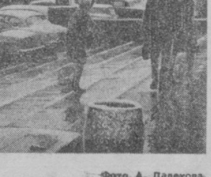
Ташкент. Морозный снег.

Сегодня по предсказаниям синоптиков в Ферганской долине ожидается переменная облачность, снег. На остальной территории — небольшая, местами переменная облачность, без осадков. Ветер — северо-восточный, 5—10 метров в секунду. Температура в Каракалпакской АССР, Хорезмской, Бухарской областях — 0—5, на остальной территории республики — 5—10 градусов тепла. В Ташкенте синоптики предсказывают небольшую облачность, без осадков, ночью туман, ветер северо-восточный, 3—7 метров в секунду. Температура ночью — 4—6 градусов мороза, днем — 6—8 градусов тепла.