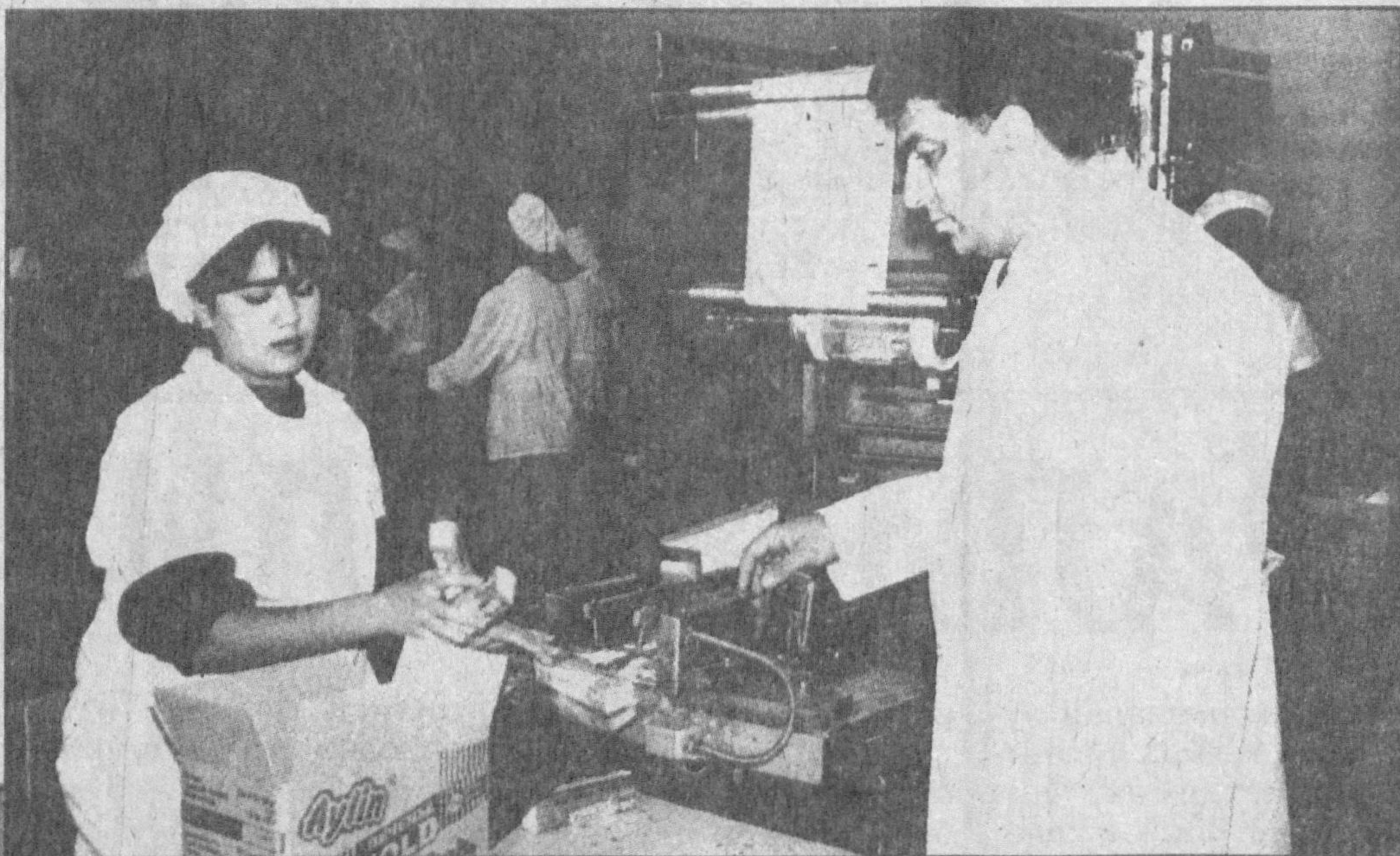
Суратларда: «Айлин» Ўзбекистон-Туркия қўшма корхонаси ҳаётидан лавҳалар.

Туркиялик ҳамкорлар билан алоқа ривожланиётганлиги ишлар кўламини янада кенгайтириш имконини бермоқда. Хусусан, «Косонсой-Текмен» қўшма