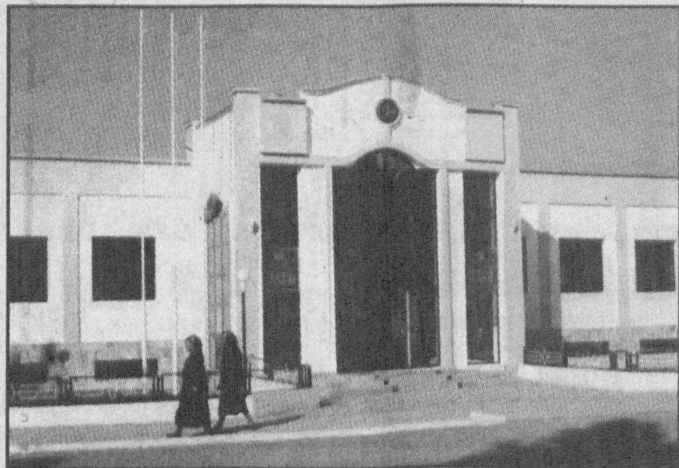
Болтабоев фазхрийлар билан доимо мулоқотда. 2. Янги бинонинг умумий кўриниши.

Суратларда: 1. Туман молия бўлими бошлиғи Нишонбой