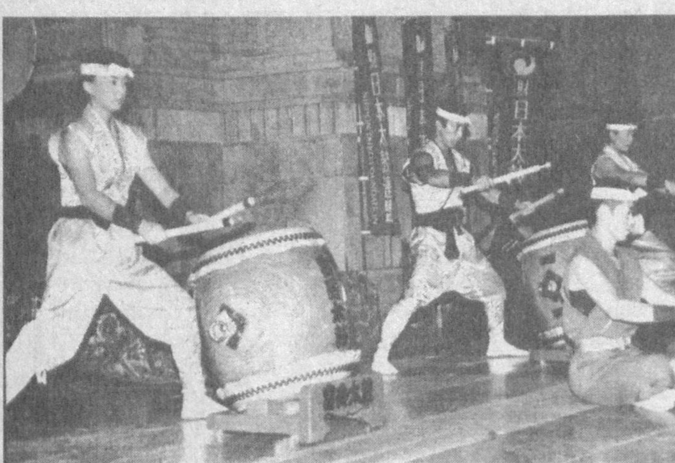
Пойтахтимизда Япония маданияти кунлари муваффақиятли ўтди. Япониялик санъат усталарининг чиқишлари барчада катта таассурот қолдирди.