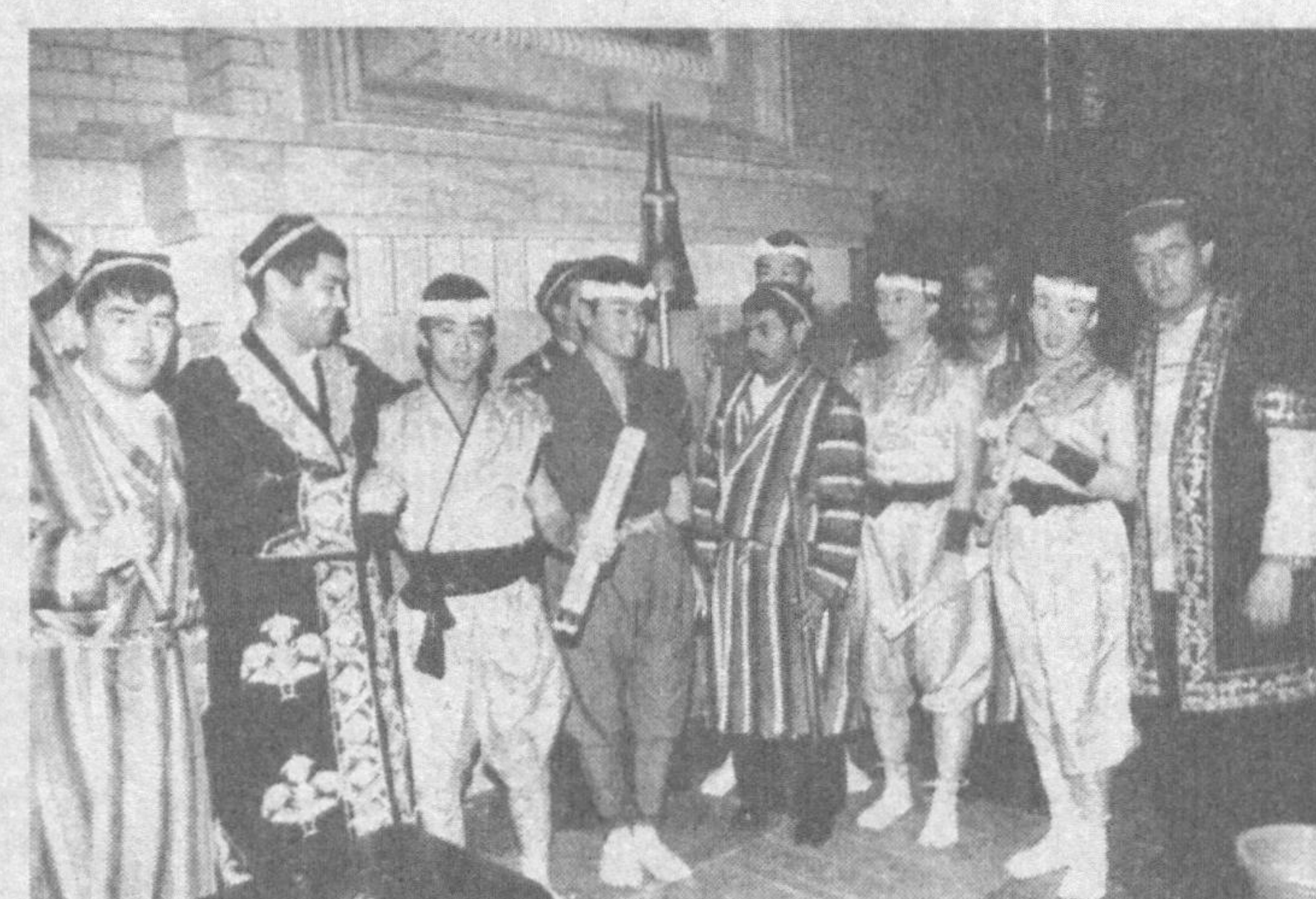
Айниқса, Алишер Навоий номидаги Академик Катта театрида ўтган концерт дастурида ногорачилар гуруҳининг юксак маҳорати томошабинларнинг давомли олқишлари билан кутиб олинди. Суратларда: концерт пайти.