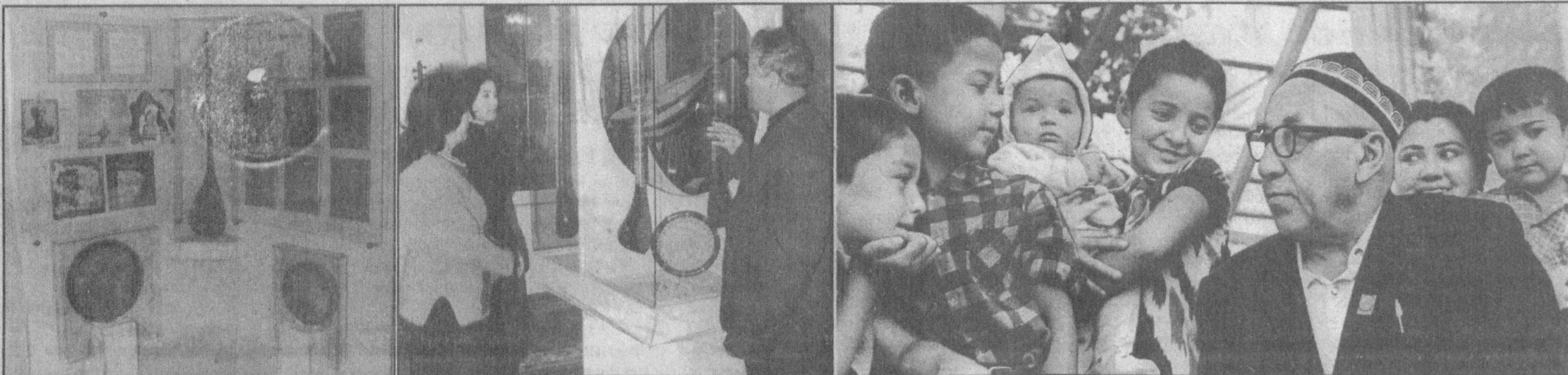
Тошкент шаҳрининг кўхна мавзелари-дан бирида табаррук инсон, академик Юнус Ражабий 1957 йилдан то умрининг охиригача яшаб, ижод қилган уй бор. Мумтоз мусиқамиз ривожига бемисл хисса қўшган истеъдодли бастакорнинг бугунги кунда нодир санъат дурдоналарига айланган 5 жилдлик «Ўзбек халқ мусиқаси», 6 жилдлик «Шашмаком» каби асарлари шу уйда яратилган. 1989 йил уй-музейга айлантирилгандан буён табаррук қадамжо доимо зиёратчилар билан гавжум.