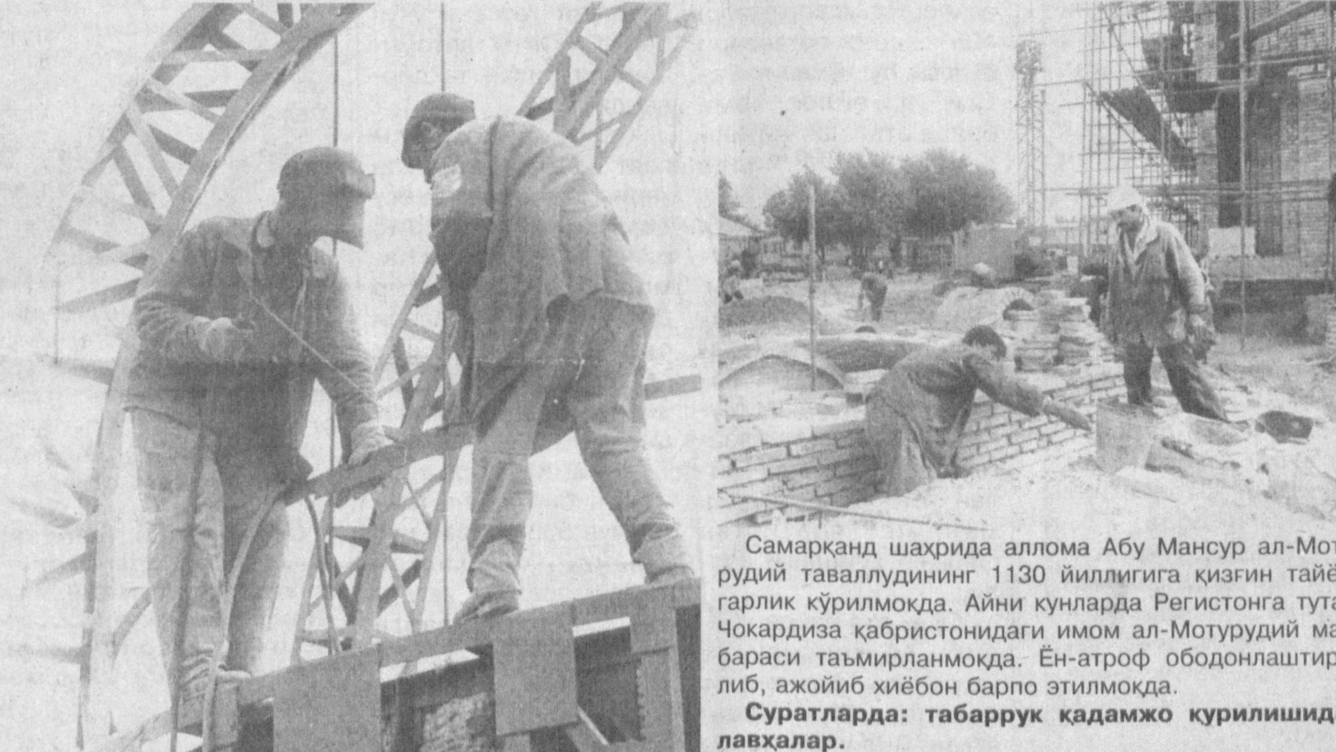
Самарқанд шаҳрида аллома Абу Мансур ал-Мотурудий таваллудининг 1130 йиллигига қизган тайёргарлик қўрилмоқда. Айни кунларда Регистонга туташ Чокардиза қабристонидидаги имом ал-Мотурудий мақбараси таъмирланмоқда. Ён-атроф ободонлаштирилиб, ажойиб хиёбон барпо этилмоқда. Суратларда: табаррук қадамжо қурилишидан лавҳалар.

Б.САИДОВ, Шахрисабз тумани ҳокими ўринбосари.