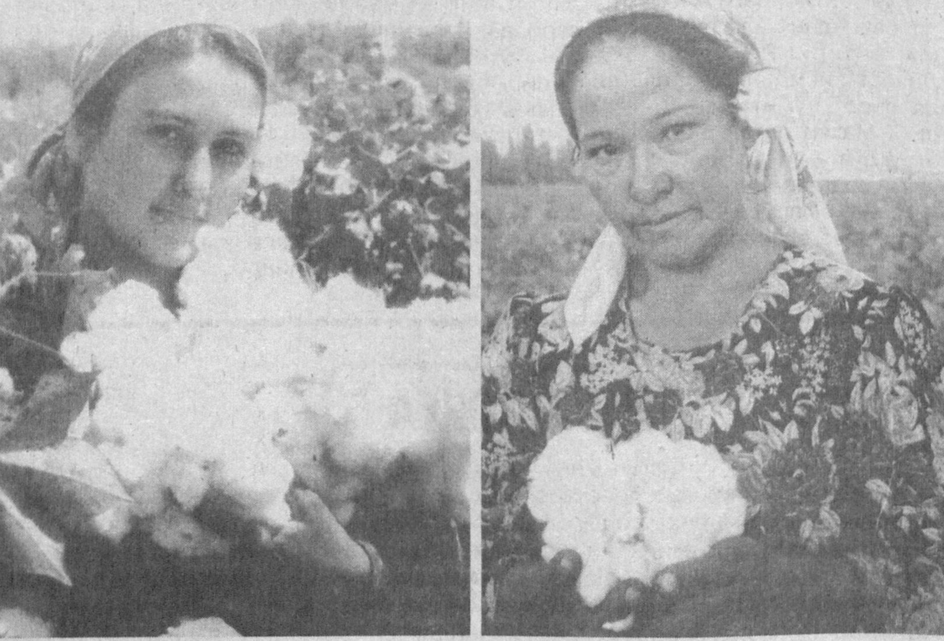
Жорий йилда андижонлик пахтакорлар барчага наму- на бўлишди. Уларнинг эр- талайшар ва сифатли ҳосил етиштиришдаги қимматли тажрибалари эндиликда кенг оммалаштирилмоқда.

У ҳам ота изидан бо- риб деҳқончиликда ўзига хос янгиликлар яратди. Жумладан, ўтган йили 55 тонна галла, 603 тонна пахта етиштирди. Пахта те- рими кўл қучисиз 3 та