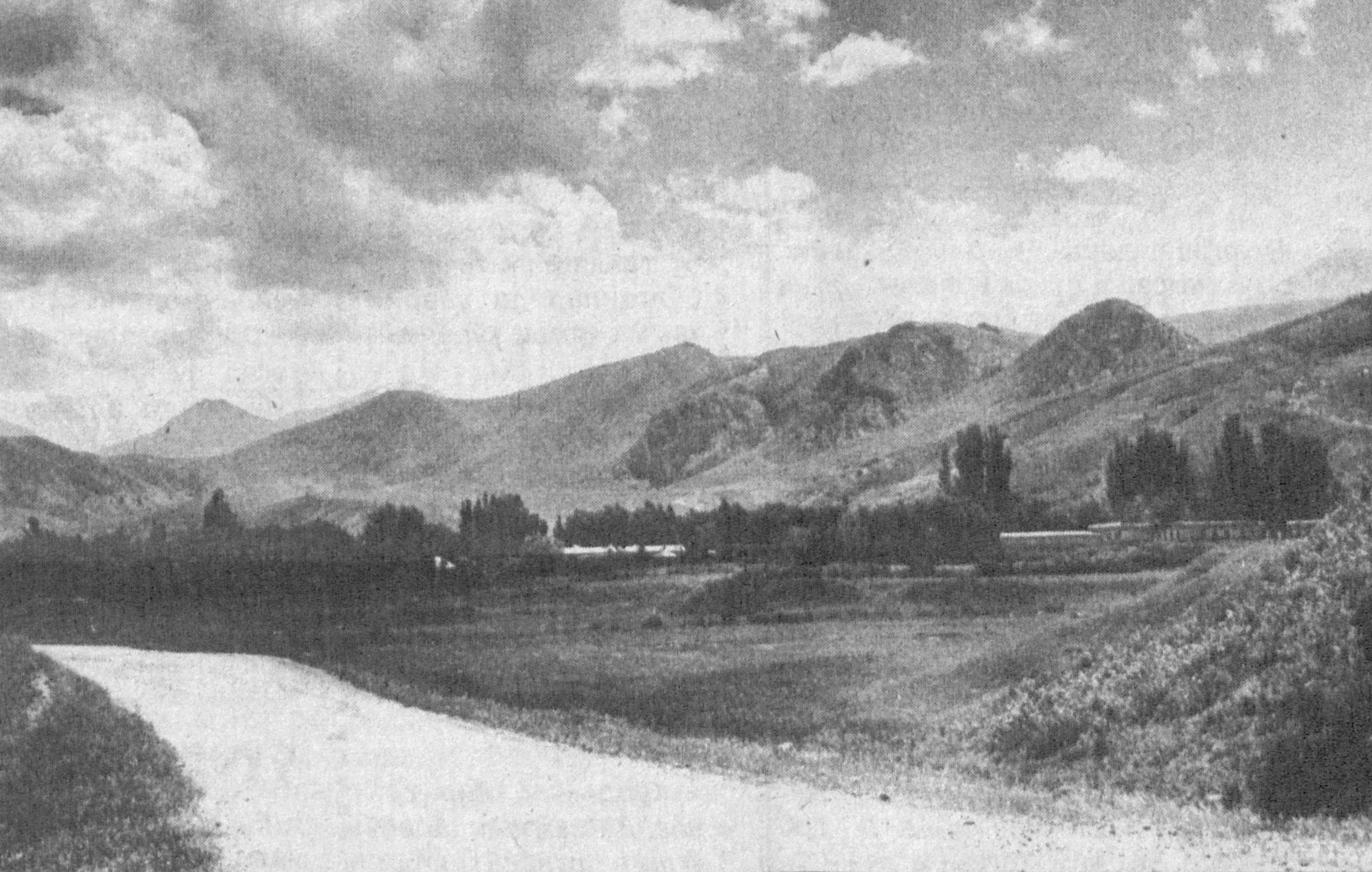
Тунги ёғду. Дам олиш дастури.