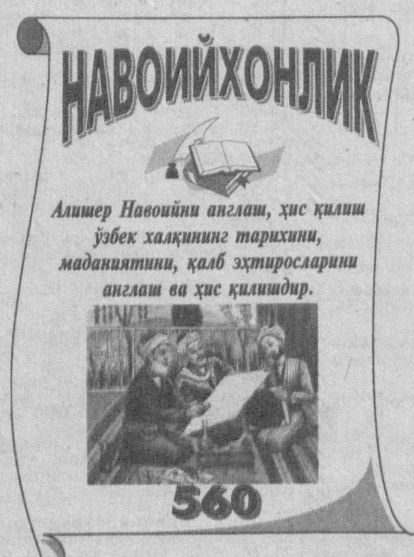
Алишер Навоийни англаш, ҳис қилиш ўзбек халқининг тарихини, маданиятини, қалб эҳтиросларини англаш ва ҳис қилишдир.

ратда ёнишининг сабаби, унинг сифат ва даражаси («бир навъ») ва чегараси (яхшиларнинг энг яхшисидан ҳам малол этиш) аниқ ифодаланган. Аммо ўша «бир навъ»нинг мазмун-моҳияти нимадан иборат, у қандай изтироб ва кайноқларга ишорат қилади? Буни тўғридан-тўғри тавсифлаш қийин. Зеро, у ахли даврон фелъ-атвори ва ахли давронга ҳолис муносабатдан қайноқланган надомат эрур. Донишмандлар демишларки, дунё дунё бўлганлиги учун эмас, мол-мулк, лазазат ва шодликлари билан одамларни ўзига тобе қилиш учун яралгандир. Шу боис ишққа, завқ ва маърифатга доир бўлмаган сўзларни тасаввуф ахли «дунё калони», деб билганлар ва бундай сўзларни гапирмаслик, имкон қадар тингламасликка ҳаракат қилганлар. Шу маънода улуг шоир, мутасаввиф ёки алломаларнинг дилга ранж этказишда ахли дунё билан ахли даврон дерили тенгдир.