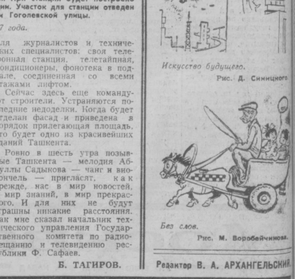
Искусство будущего. Рис. Д. Синицкого. Без слов. Рис. М. Воробейчинова.