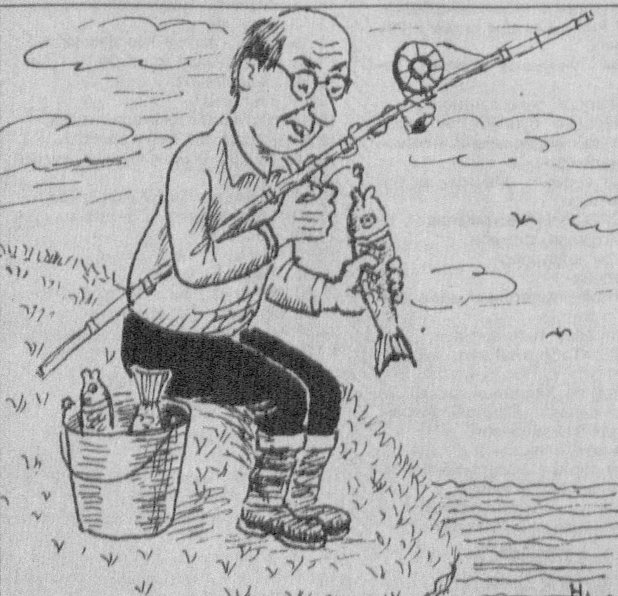
Нафақадаги тиш шифокори балиқ овида: — Қани а-а-а, деб юбор-чи, қармоқни тортиб оламан.