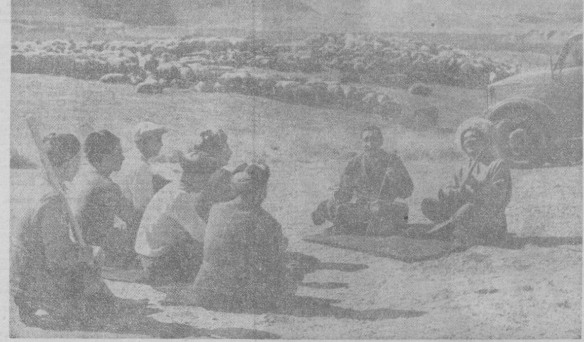
Вчера открылась декада туркменской литературы и искусства в Узбекистане. Перед трудящимися нашей республики выступят талантливые певцы и танцоры братской республики. Многие из них начинали свой путь в коллективах художественной самодеятельности, как эти артисты Ташкентского народного театра, выступающие на орономном пастбище перед чабанами.