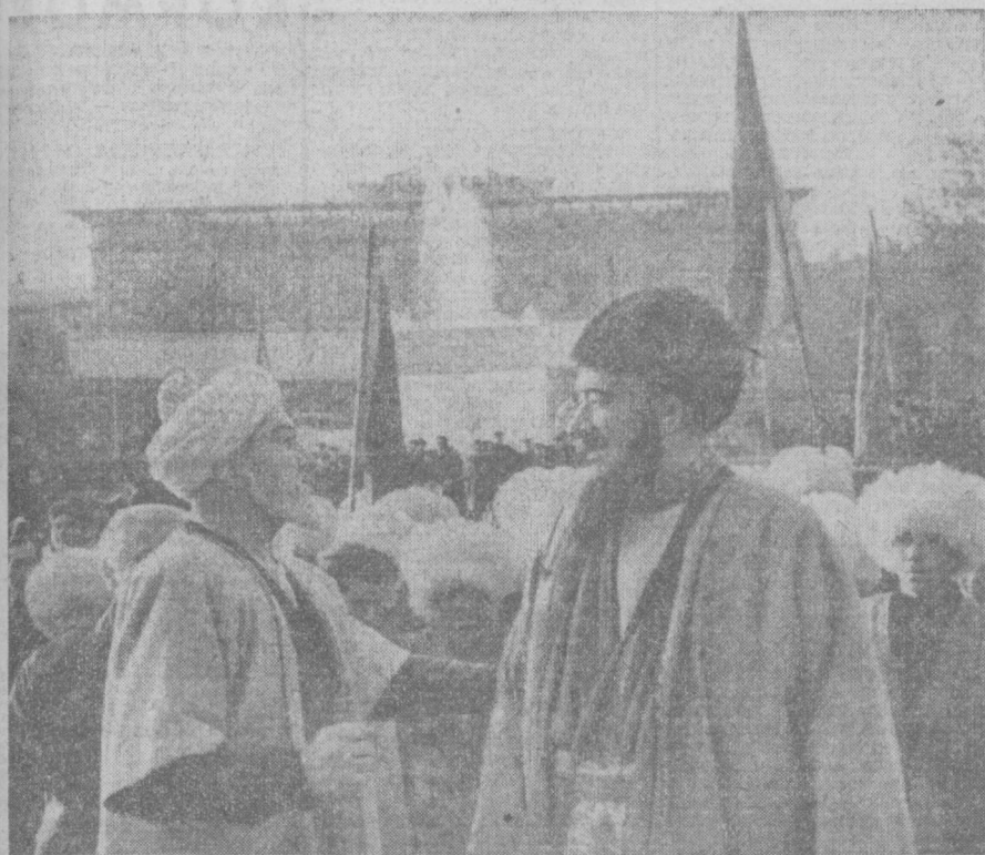
ТОРЖЕСТВЕННОЕ ОТКРЫТИЕ ДЕКАДЫ ТУРКМЕНСКОЙ ЛИТЕРАТУРЫ И ИСКУССТВА В УЗБЕКИСТАНЕ

№ 260 (15205) | Воскресенье, 13 ноября 1966 года | Цена 2 коп.