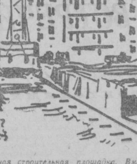
Сегодня Ташкент — всеобщая строительная площадка. Вместе с посланцами всех союзных республик с большим энтузиазмом здесь трудятся строители братского Туркменистана. 9 тысяч квадратных метров жилья или шесть 48-квартирных домов подарит столице Узбекистана Туркмения. Строители едут на работу в двух домах, которые будут отданы в эксплуатацию уже в ноябре. Монтажные работы идут полным ходом. А рабочие готовят задел будущего под пятой и шестой туркменские дома в Чиланзаре. Строительство ведут работники Чарджуйского домостроительного комбината.

Большим успехом у трудящихся Узбекистана пользуются выступления ансамбля дутаристов Туркменского радио и телевидения.