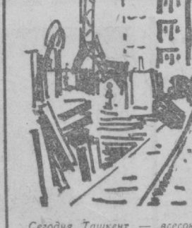
Сегодня Ташкент — всеобщая строительная площадка. Вместе с посланцами всех союзных республик с большим энтузиазмом здесь трудятся строители братского Туркменистана. 9 тысяч квадратных метров жилья или шесть 48-квартирных домов подарит столице Узбекистана Туркмения. Строители едут на работу в двух домах, которые будут отданы в эксплуатацию уже в ноябре. Монтажные работы идут полным ходом. А рабочие готовят задел будущего под пятой и шестой туркменские дома в Чиланзаре. Строительство ведут работники Чарджуйского домостроительного комбината.

Большим успехом у трудящихся Узбекистана пользуются выступления ансамбля дутаристов Туркменского радио и телевидения.