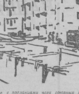
Сегодня Ташкент — всеобщая строительная площадка. Вместе с посланцами всех союзных республик с большим энтузиазмом здесь трудятся строители братского Туркменистана. 9 тысяч квадратных метров жилья или шесть 48-квартирных домов подарит столице Узбекистана Туркмения. Строители едут на работу в двух домах, которые будут отданы в эксплуатацию уже в ноябре. Монтажные работы идут полным ходом. А рабочие готовят задел будущего под пятой и шестой туркменские дома в Чиланзаре. Строительство ведут работники Чарджуйского домостроительного комбината.

Большим успехом у трудящихся Узбекистана пользуются выступления ансамбля дутаристов Туркменского радио и телевидения.