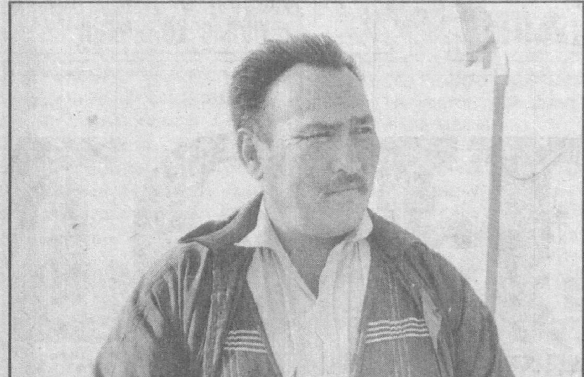
Бугунги кун бунёдкорлигида мрамарга бўлган эҳтиёж катта. Қорақалпоқ қурилиш материаллари бирлашмасининг мрамарлари айнан шу эҳтиёжни қондиришда алоҳида ўрин тутди.