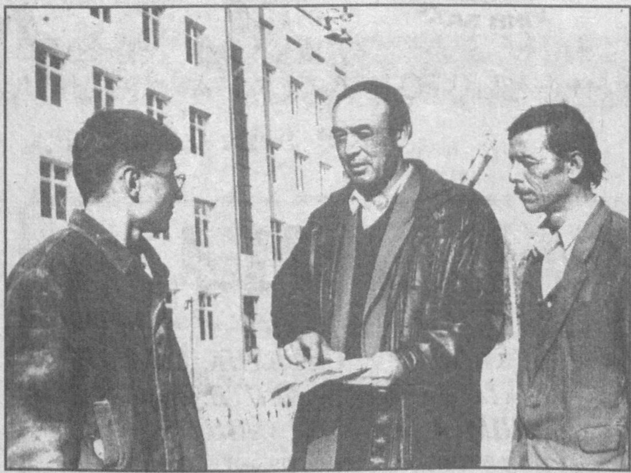
Суратларда: коллеж қурилишида. Даврон АХМАД олган суратлар.

Ангрен шаҳрида 900 ўринга мўлжалланган маиший хизмат коллежи қурилоқда. Унинг бош пудратчиси Ўзбек шахта қурилиш хиссадорлик жамияти курувчилари бўлиб, бу ерда ўқувчилар учун футбол, волейбол, теннис майдончалари фойдаланишга топширилади.