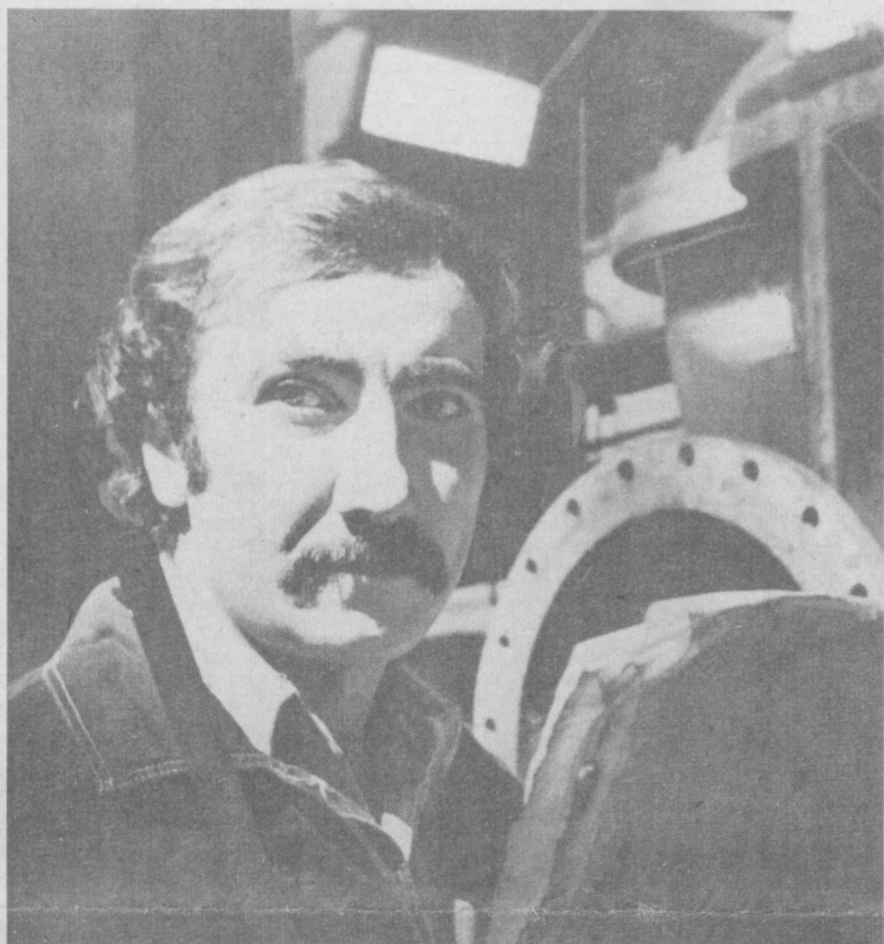
ЎЗБЕКИСТОН ССР Мелiorация ва сув ҳужалиги министрининг Наркомонадаги «Ирригация» корхонасида меҳнат қилаётган кўпчилиги ишчилар КПСС XXVII съезди шарафига зиммаларига шахсий мажбуриятлар олиб...