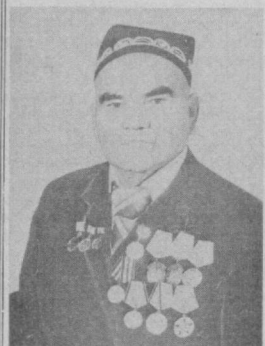
ОРТИҚҲУЛ ака идорада ўтиришни ёқтирамади. Дадага чиқса кўнгли яйрайди.