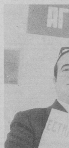
Бекобод районидagi Ойбек номи совхозда жойлашган 81-Чаноқ сайлов округи агитаторлари аҳоли ўртасида оммавий-сиёсий ишларни аниқ олиб бериш мақсади билан катта маъруза берди.

«Энергетик» маданият саройида очилган «Беш йиллик одамлар» тематик виставкани Тошкент ГРЭСИ микрорайонининг бугунги кунга ва уни ривожлантириш истиқболларига бағишланган фотокунояга асос бўлди. Виставка Олий Советига ва ҳалқ депутатлари маҳаллий советларига бўлажак сайловга бағишланди.