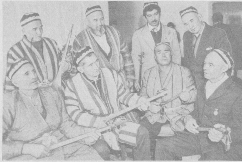
СУРАТДА: Чори бахши (чапдан биринчи) ўз ҳамкасблари даврасида.

МЕЗОНЛАРДАН бўйинга тақинчоқ таққан, қуёшни шаробдек сикорган кунлар, бебаҳо эҳсонлари билан Ўзбекистон бугунга жойлаштирган эрта кунларнинг бирини Самарқанддан қайтган ижодий экспедиция Бўғача бурлиди.