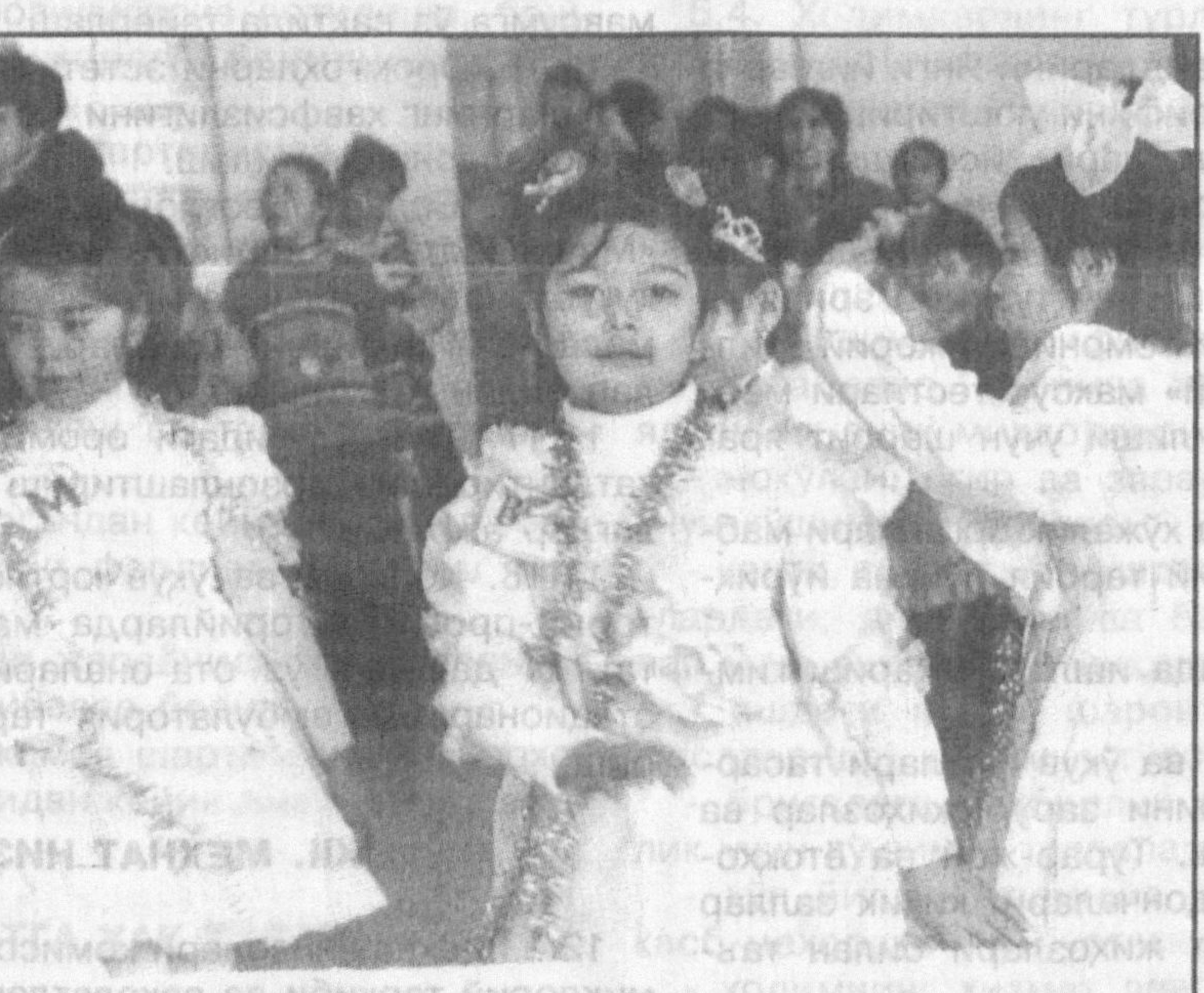
Суратларда: «Алифбе байрами»-дан лавҳалар.