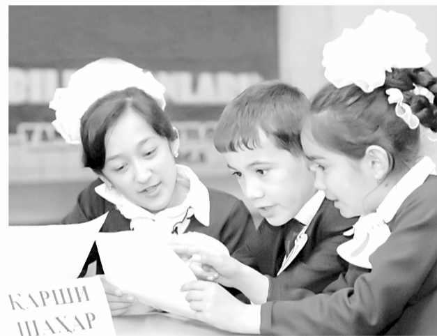
Уса олган сурат.