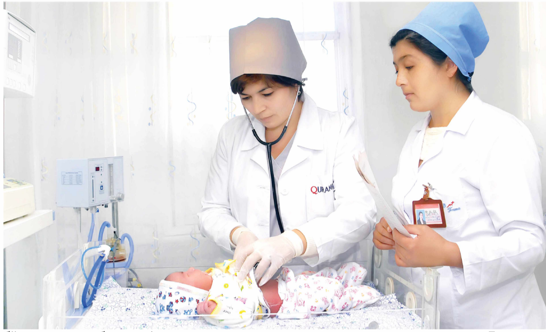
У-а олган сураб.

Она ўз танасида яна бир юрак уриб турганини ҳис қилдим, ўша заҳотиёқ уни ташқи муҳитдан ҳимоя қилиши, ўзини касалликлардан асраши лозим. Аслида, фарзанд саломатлиги учун нафақат она, балки ота ҳам бирдек масъул. Ҳомилаларлик даврида аёлни турли стресслардан сақлаш, асабийлашишига йўл қўймаслик, овқатлини рақсонини тўғри ташкил қилиш ва дам олиши учун шартин яратиш ҳам асосий вазифалардан ҳисобланади. Энг ававало, она овқатларида маълум қондаларга амал қилиши зарур. Гўдак яхши ўсиши учун кундалик таомномага витаминга бой маҳсулотлар, яъни, углеводли овқатлар, оксил тақчиллигига барҳам берадиган товуқ, балиқ, дуккакли ўсимликлар, таркибида калций моддаси мавжуд сут, пишлок, қатқ сингари егуликлар албатта киритилиши керак. Кўпчилик аёллар кофе ва бошқа бир қатор газли ширин ичимликларни севиб истеъмол қилади. Уларнинг ҳомилага салбий таъсири исботланмаган