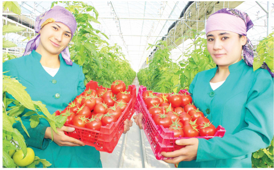
Уста олган сурат.

Қорамонлик уста миришкорлар етиштирган нематларни нафақат вилоят маркази Урганч шаҳри, балки қўшни туманлар ва Қорақалпоғистон Республикасининг Элликқалъа, Тўрткўл, Беруний туманлари аҳли ҳам харид қилади. Бу махсулотлардан воҳада таъриф буюраётган минглаб хорижлик сайёҳлар ҳам баҳраманд.