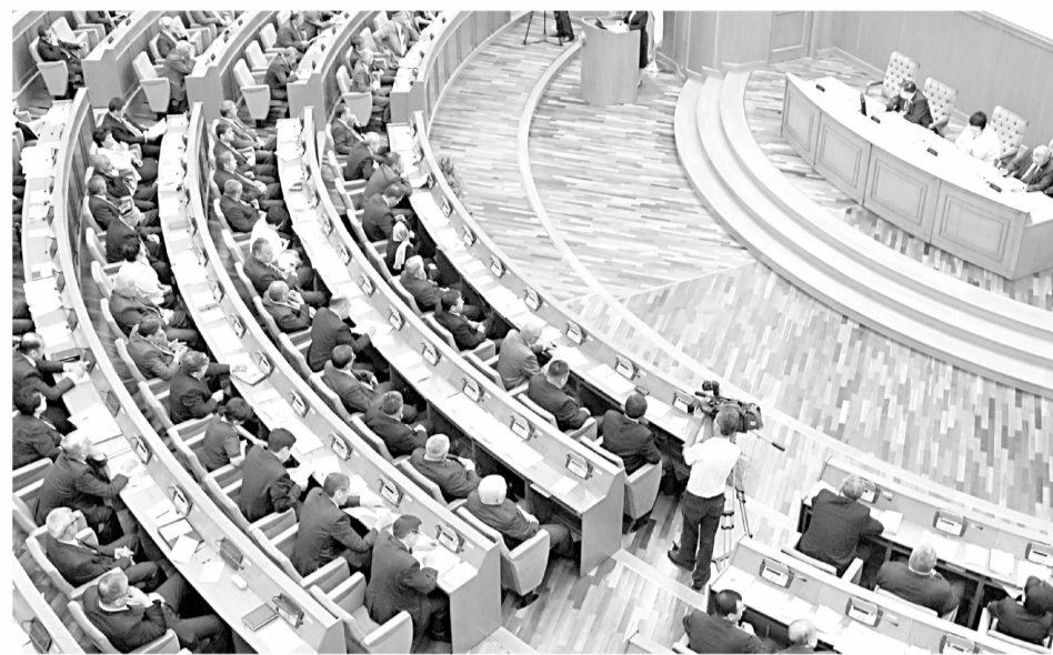
Давоми. Бошланчи 1-бета.

кўрамир. Мисол учун, қонунда нодавлат нотижорат ташкилотлар фаолиятини кўллаб-қувватлаш, бу борада аниқ механизм асосида ишни ташкил қилиш назарда тутилган.