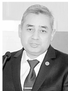
ЎЗХДП Марказий Кенгаши раиси Хотамжон КЕТМОНОВ сайлов кампанияси даврида партия ташкилотлари зиммасида турган энг муҳим вазифалар ҳақида маъруза қилди.

тенг шароит яратиш ҳамда сайловлар очиқлиги ва ошқоралигини таъминлашга қаратилган қатор ўзгариш ва қўшимчалар киритилгани вакиллик ҳокимиятига энг муносиб номзодлар сайланишига мустаҳкам замин яратмоқда. Бу эса бир вақтнинг ўзида сиёсий партиялар фаолиятини тобора кучайтириб бориш, мамлакатни комплекс ижтимоий-иқтисодий ривожлантиришнинг устувор вазифаларини амалга оширишида уларнинг ролини кенгайтиришни талаб этади.