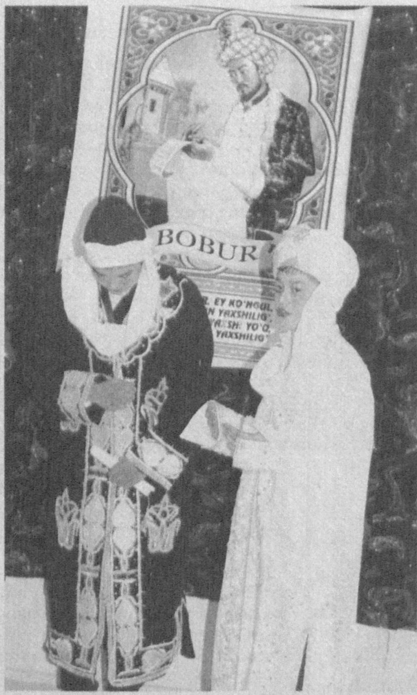
садга хизмат қилаётганини таъкидлади. Шундан сўнг ўқувчилар шоирлар шеърларидан намуналар ўқиб, уларнинг ҳаётини акс эттирувчи сахна кўринишлари намойиш этишди.

Шу кунларда мамлакатимизда буюк мутафаккир шоирлар Алишер Навоий ва Заҳриддин Муҳаммад Бобур таваллуд кунларига бағишлаб кўллаб маърифий тадбирлар, адабий кечалар, илмий анжуманлар, мушоиралар ўтказилмоқда.