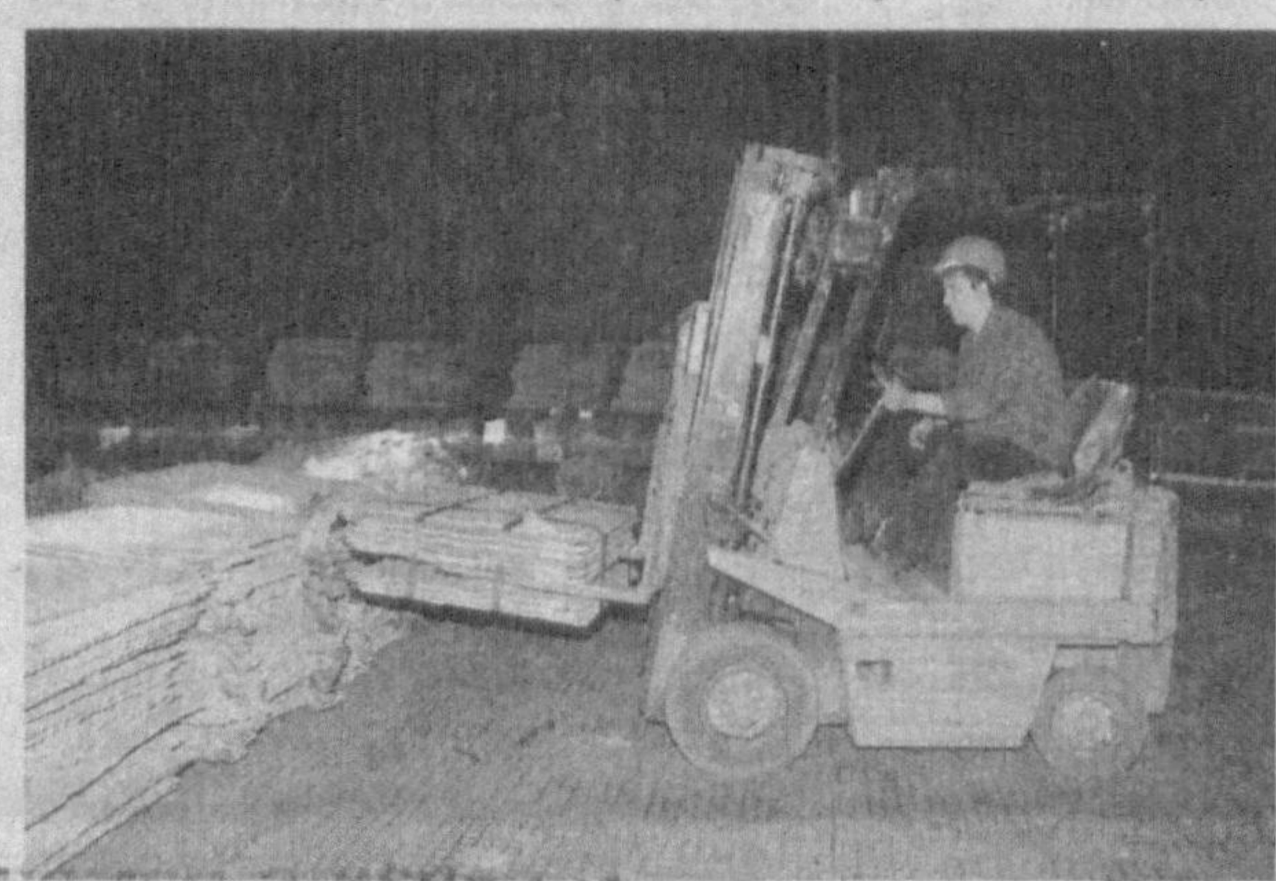
Неъмат РАФИҚОВ, «Ishonch» мухбири

Меҳнатни муҳофаза қилиш доимий назоратга олинган. Ишчи-хизматчиларнинг соғлигини асрашга маъмурият ҳам, касба уюшма ташкилоти ҳам муҳим вазифа сифатида қарайди. Ўтган йили ушбу мақсад учун 1 млрд.165 млн. 715 минг сўм сарфланди. Шу билан бирга, жамоатчилик асосида сайланган меҳнат муҳофазаси бўйича вакилларнинг ўқиши ҳам мунтазам равишда ўтказилаётди.