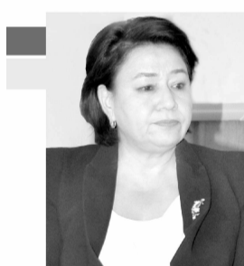
Шарбат АБДУЛЛАЕВА, ЎзХДП Марказий кенгаши раиси ўринбосари:

Шунингдек, фракцияимиз аъзолари ташаббуси билан касб-хунар коллежлари битирувчиларини биринчи бор ишга қабул қилишда дастлабки синов муддатини белгилашга оид норманинг олиб ташлангани, уларни ишдан бўшатилиш тартиби ҳам битирувчининг манфаатидан келиб чиқиб ҳал этилаётгани фикримиз далилидир. Бундан буён ҳам бандлик масаласи биз учун муҳим вазифа бўлиб қолади.