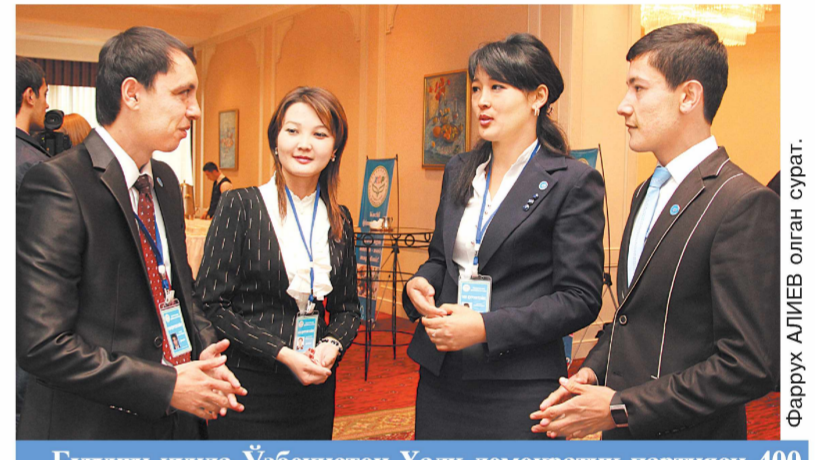
Бугунги кунда Ўзбекистон Халқ демократик партияси 400 минг аъзосининг қарийб 33 фоизини ёшлар ташкил этади.

2011 йилнинг 14 декабрь кунини фракциямиз ташаббуси билан ижро этувчи ҳокимият органларининг соғлиқни сақлаш соҳасини ислоҳ қилиш ва унда сифат ўзгаришларини таъминлашга доир фаолиятини ўрганиш мақсадида Парламент эшитиш ўтказилди. Қонунчилик палатасининг ялпи мажлисида