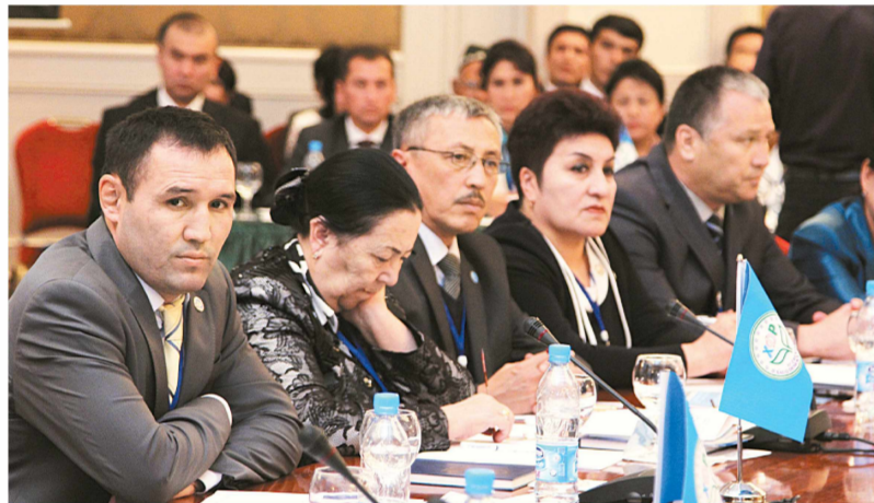
Олимпиада ўйинлари чемпиони, Ўзбекистон профессионал бокс федерацияси раисининг биринчи ўринбосари, Ўзбекистон ифтихори, ЎзХДП аъзоси Муҳаммадқошир Абдуллаев партиямиз голярини фаол қўллаб-қувватламоқда.

Курултой кун тартибига киритилган барча масалалар юзасидан партия олий органининг қарорлари қабул қилинди.