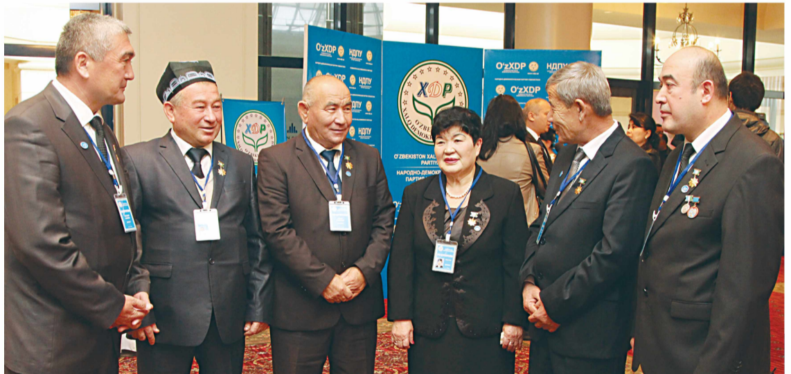
Ўзбекистон Халқ демократик партиясининг VIII қурултойида иштирок этган 8 нафар Ўзбекистон Қаҳрамони партиянинг энг фаол аъзолари ҳисобланади.

борилаётган конституциявий ислохотларни сезиларли даражада чуқурлаштириш, Олий Мажлиснинг