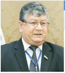
Махмуд ТОИРОВ, Олий Мажлис Сенати аъзоси, Ўзбекистон халқ шоири:

— Мамлакатимиз сайлов қонунчилигида мустахкамлаб қўйилган сайловларнинг даврийлиги ва мажбурийлиги, адолатлиги ва эркинлиги принциплари, уларнинг умий, тенг ва тўғридан-тўғри сайлов ҳуқуқи асосида яширин овоз бериш йўли билан ўтказилиши, фу-