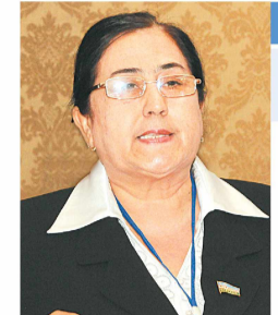
Комила КАРОМОВА, Олий Мажлис Қонунчилик палатаси депутати:

Сайловлар жараёнида партия электорати билан янада фаолроқ ишлаш, уларнинг манфаатини ҳимоя қила оладиган аъзо ва хайрихоҳлар сонини кўпайтириш, ўтказилаётган тадбирлар таъсирчанлигини оширишга эътибор қаратиш талаб этилади. Шунингдек, фаол аъзолар орасидан сайлов жараёнида партия томонидан кўрсатилган номзодлар учун курашадиган ваколатли ва ишончли вакиллари сонини кўпайтириш талаб этилади. Шунингдек, фаол аъзолар орасидан сайлов жараёнида партия томонидан кўрсатилган номзодлар учун курашадиган ваколатли ва ишончли вакиллари сонини кўпайтириш талаб этилади. Шунингдек, фаол аъзолар орасидан сайлов жараёнида партия томонидан кўрсатилган номзодлар учун курашадиган ваколатли ва ишончли вакиллари сонини кўпайтириш талаб этилади.