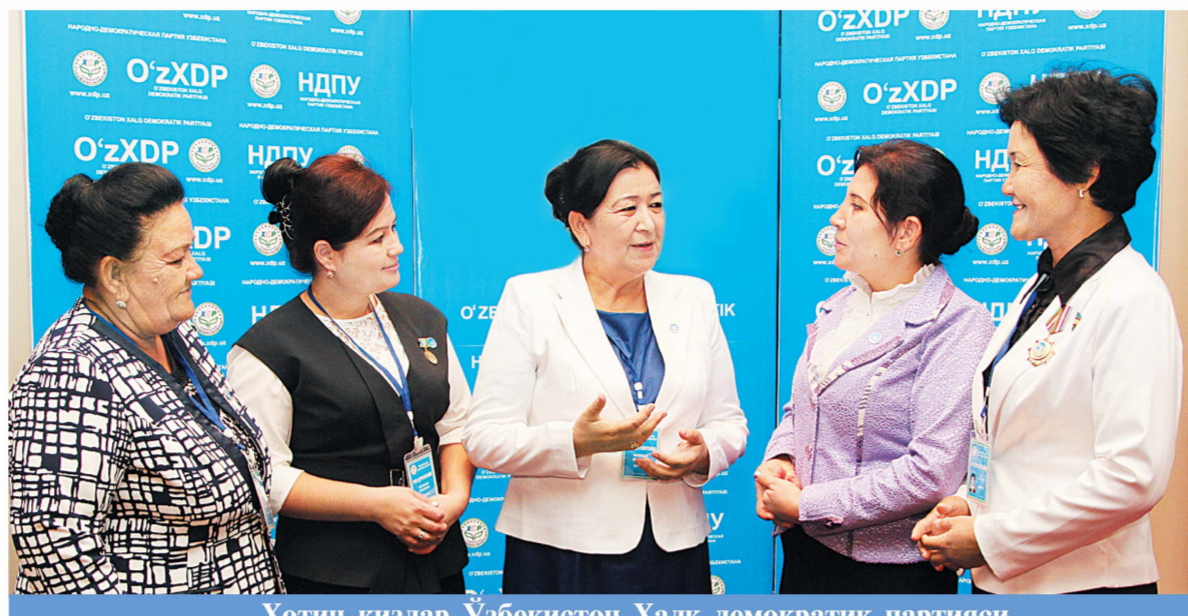
Хотин-қизлар Ўзбекистон Халқ демократик партияси сафида тобора етакчи қучга айланиб бормоқда

Бундан ташқари, жойларда партия гуруҳлари ташаббуси