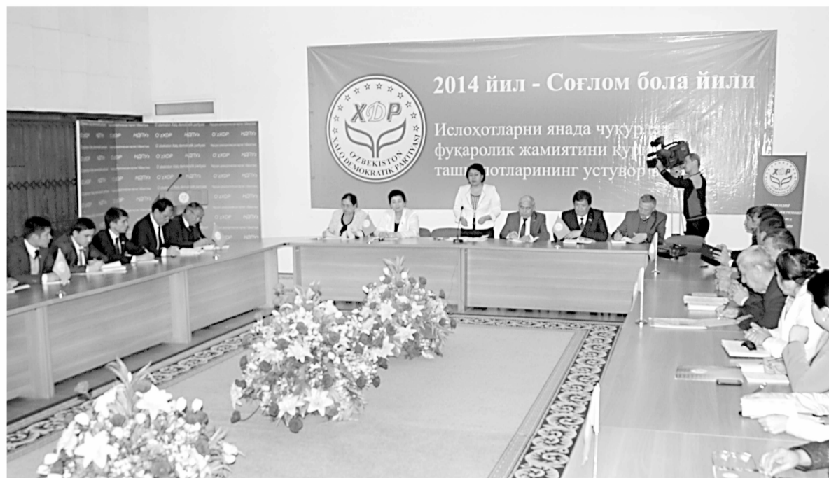
Самарқанд ШОТЛУЛАГАНОВ олган сурат.

Хусусан, депутатликка номзодларнинг ишончли вакиллари сони 5 нафардан 10 нафарга кўпайди. Сайлов тўғрисидаги қонун ҳужжатларига сиёсий партиянинг «ваколатли вакили» деган янги институт киритилиб, уларга имзо варақаларининг тўғри тўлдирилишини текшириш, сайлов участкаларида овозларни санаб чиқишда иштирок этиш ҳуқуқи берилди.