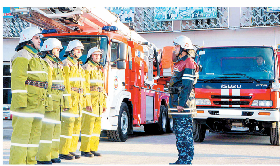
УАА оlingan сурат.