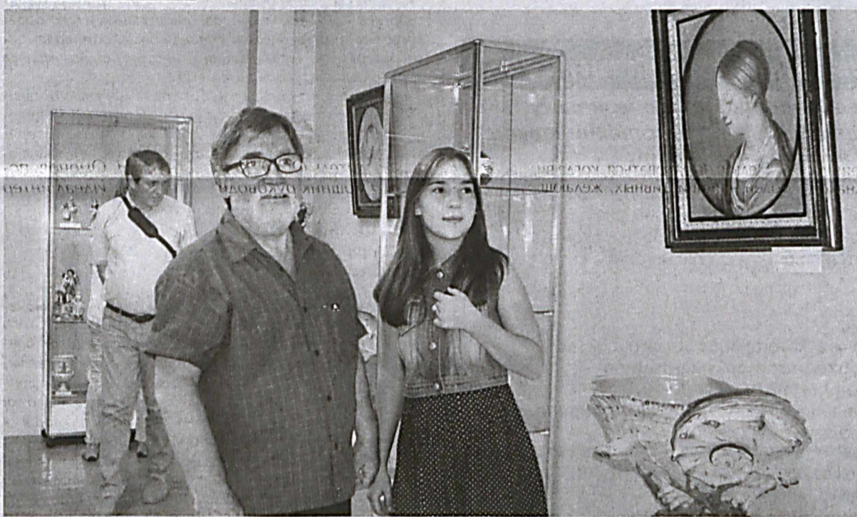
Уникальная экспозиция произведений декоративно-прикладного искусства России и Западной Европы периода XVIII - начала XX веков под названием "Очарование эпохи" открывалась в Государственном музее искусств Узбекистана - одном из самых крупных музеев Центральной Азии, отмечающем в этом году свой столетний юбилей. Работы, многие из которых зритель увидит впервые, - из его коллекции.