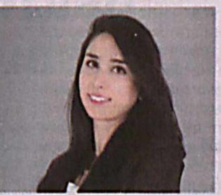
Синем ЖЕНГИЗ, Марказий Осиё ва Яқин Шарқ мамлакатлари бўйича эксперт.