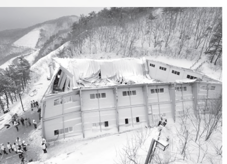
Интернет хабарлари асосида Асила ИБРАГИМОВА тайёрлади

Мамлакатнинг Кёнчжу шаҳрида бинонинг қулаб тушиши оқибатида 100 дан ортиқ одам жароҳатланган, қариб 20 киши бедарак йўқолган, ҳалок бўлганлар ҳам бор. Фожеа юз берган пайтда бинода талабаларга бағишланган кеча ўтказилаётган эди. Тахминларга кўра, маросимда 500 га яқин талаба қатнашган. Маҳаллий ОАВ вакилларининг хабарига кўра, кутқарув ишлари ва жароҳатланганларни эвакуация қилишга об-ҳаво халал бермоқда. Жароҳатланган талабаларнинг умумий сони 112 нафарни ташкил қилган. Айни дамда воқеа жойида кутқарув хизматининг 400 нафар ходими қидирув ишларини давом эттиришмоқда.