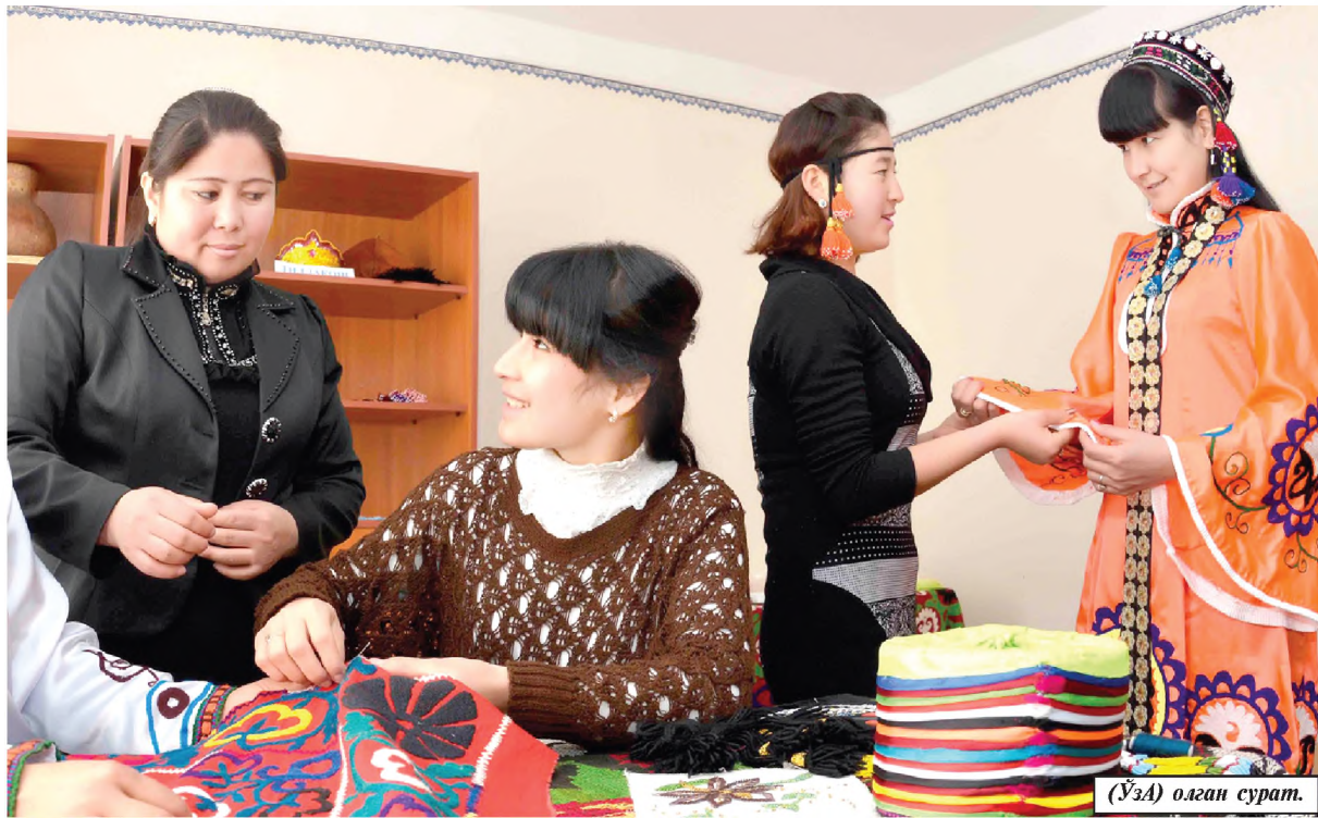
(ЎЗА) оёқан сурат.

Қўлигул хунармандларимиз ақлу заковати, машаққатли меҳнати эвазига яралган амалий санъат намуналари ҳар қандай одамни ҳайратга солиши табиий. Айниқса, бундай буюмлар аёл хунармандлар томонидан тикланган бўлса, ўзининг нафислиги билан ҳам ажралиб туради.