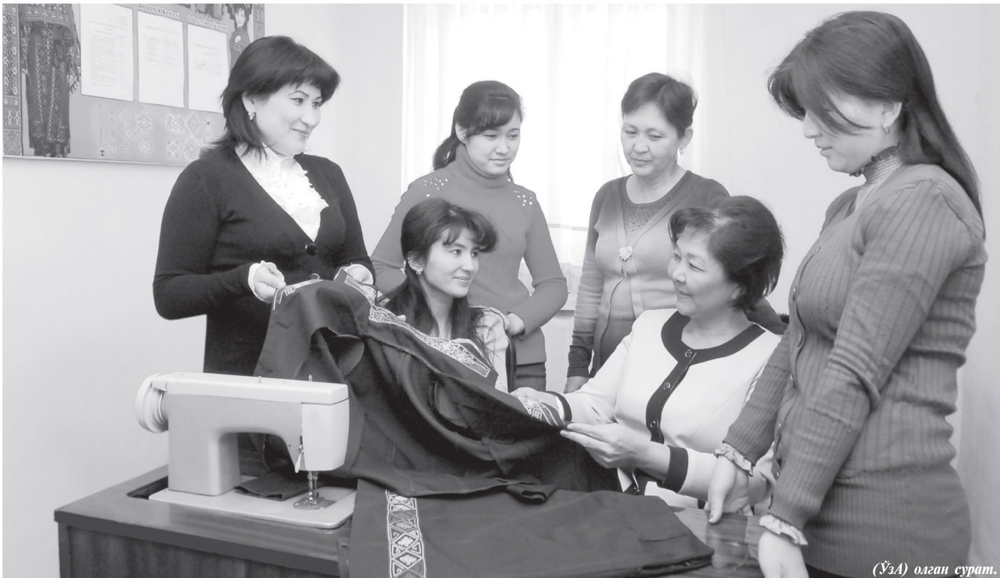
(ЎЗА) олган сурат.