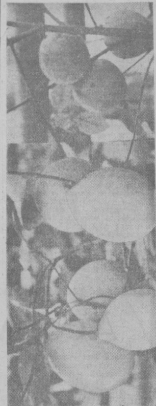
Янги йил дастурхони.

қўяди. (Қўлига рўмоли тутиб) Гирилла! (Хасан кирди.) Хасан — Ҳа, ўғлим, башаранг тиришиб турибди. Меҳри — Кеча «2» олибди. Ўқи тувишга айтиб қўйинг, қўригани шу бўлиб қолди. Нукул «2» қўйишини. У қанча ўқитувчи ўзи. Хасан — Ташвиш қилма. Ўқитувчинга ўзим гапириб қўйма. Меҳри — (Ўғлига қараб) Ана, шунданми? Хасан — Қабрида кетаяпти? Меҳри — Ҳаражатга. Хасан — Бор, сўлжаймай. (Садири чиқиб кетди. Хасан Меҳрига қараб) Ўзи бу йил ўғлини 6. синфда ўқитгани, ёни 7-синфдами? Меҳри — (ўйлини) Ўтган йили 6-ни битирибди, 5-инми? Хасан — Ҳа, кел қўй, ҳали ўзидан сурагани... Хасан, хоним, янги йил дастурхонига нималар тайёрладилар, ана буни гапиринг. Меҳри — Янги йил дастурхони кўнгалдагидек. Нима деган бўлсангиз ҳаммасин тайёр. Хасан — Дастурхон «5» дегил! Меҳри — «5»! Ж. АСОМИДИНОВ.