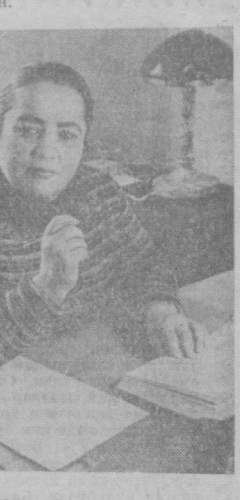
Ижобий иланиш ва медицина фаолиятининг айрим муаммоларини ҳал этишда ҳам айрим ютуқлар қўн-қўн яратилди. Гранит чагининг организмга таъ-сир бўйича олиб бораётган тадбиротларим шўҳосига етай деб қўн-қўн. Гранит чагининг сўн-қўн характерига оид мо-нографиям босилмоқ қўн-қўн.

Шонли йилномамиз китоби-нинг янги бир зарҳал варағи очилди. Янги қўн-қўн йилга қа-дам қўн-қўн. Одатда, шундай айём кўн-қўн ўтган қардон йилда қўн-қўн ўтган, юз берган қўн-қўн воқеаларини бир-бир эслайсан, киши!