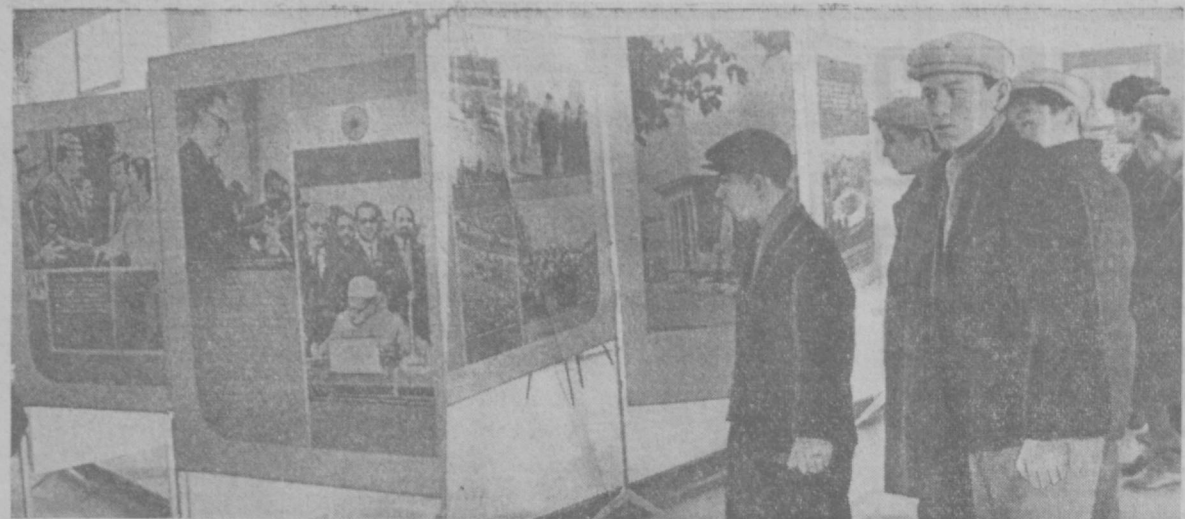
Суратда: выставка залда.