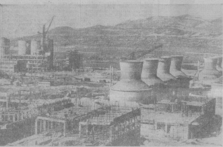
Болгариянинг химия соноати йил сайин ривожланиб бормоқда. 1967 йилда янги улкан химия заводлари ишта тушди. Суратда: Врана шахридаги бунёд этилаётган химия комбинати тасвирланган.

Бреннер мамлакат бюджетининг 25 процентдан ошиб кетган ҳарбий харажатларини қайтаришга даъват қилди. Кинзингер ҳукумати ўтказиб берилган солиқларни ошириш сиёсати, деб таъкидлади у. Германия Федератив Республикасида нарх-навоининг янада ошиб кетишига сабаб бўлади.