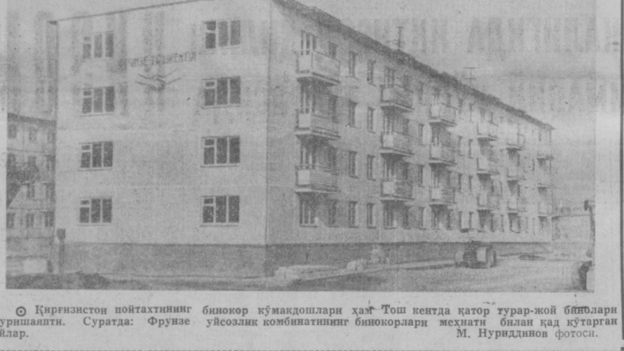
Фрунзе уйлари. Суратда: Фрунзе уйлари.