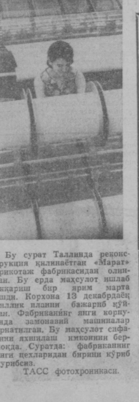
Бу сурат Таллинда реконструкция қилинаётган «Марат» трикотаж фабрикасида олинган. Бу ерда мажусулот ишлаб чиқариш бир ярим марта ошди. Корхона 13 декабрда йиллик планини бажариб қўйган. Фабриканинг янги қорғусида замонавий машиналар ўрнатилган. Бу мажусулот сифатини яқинлаш ишонини бермоқда. Суратда: фабриканинг янги нехларидан биричи қуриб турилиши.