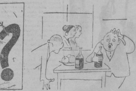
Иштирт ичкиликни, барибир фойдаси йўқ! — Нега? — Кўрмаласани, ревизорлар аёллар экан... А. Холиқов чизган расм.