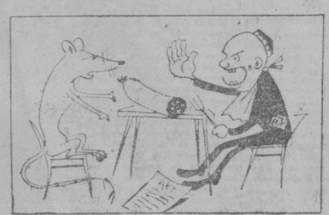
КАЛАМУШ:— Ҳай ноинсоф! Анда-ку мети айбдор қилиб қўрсатдинг; қазига шерик қил энди мения...