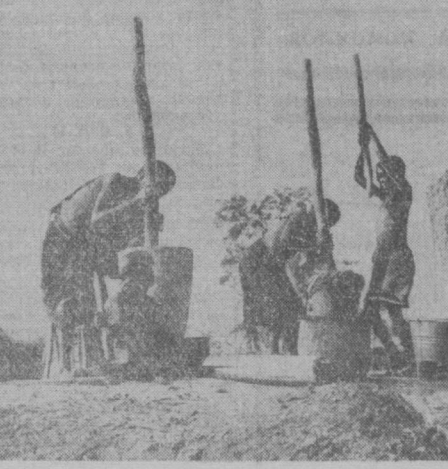
МАЛАВИ. Қишлоқ аёллари мана шу усулда жўхори уни таёёрлашади.

НЬЮ-ЙОРК. (ТАСС). Қўшма Штатларда одатдан ташқари қаттиқ совуқ бошланди. Информация агентлиқларининг хабар беришича, баъзи шаҳарларда температура нундан (селинчи бўйича) 46 даража пастга тушиб кетди. Висконсин штатида энг қаттиқ совуқ қайд қилинган. Бу ерда нор бўрони ва қорасовуқдан ҳозирдаёқ 9 киши ҳалок бўлган. Теннесси штатида қаҳратон совуқ турганини сабабли мактабларда ўтказилган машғулотлар тўхтатилган.