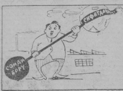
Изоҳга ҳолат йўқ...