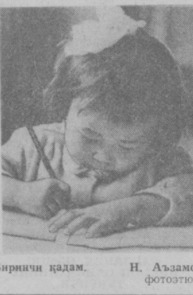
Биринчи қадам.

комбинатини пардозлаш ишла- ри тугалланган деб қолди. 6- микрорайонда 320 ўринли мак- таб биноси қурилишига қўя- урилди. Металлурглр посёл- касида 2 қаватли универсал мағалзич қад кўтарарди. Бундан ташқари шаҳарда политехника техникуми қури- лиши кўзда тутилмоқда. Уа- гостропект ижодкорлари ҳозир бино лойиҳасини тайёрламоқ- далар. Техникум биносига яқин қуиларда пойдевор қуиллади. Шаҳарда беш йилликнинг иккинчи йилида янги меҳмон- хожа куриш кўзда тутилмоқда. Коммунал хизмат янда яхши- ланади. Бир сўз билан айтган- да Бекобод чиройига чирой қўшилмоқда.