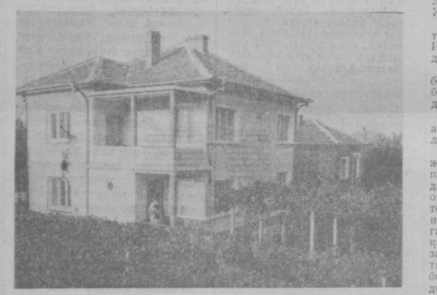
Момково қишлоғидаги кўчалардан бири.

қўйилиши, экинлар парварошиш теплицанинг иситилиши ва унинг рентабеллиги ҳақида ҳўжалик раҳбарлари мутахассенлар билан суҳбатлашарди.