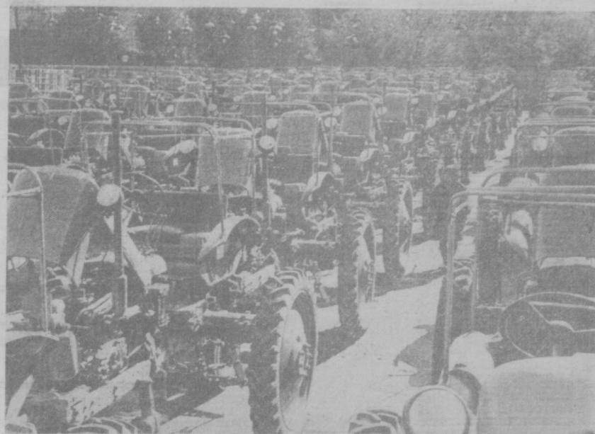
Пойтахтдаги йirik машинасозлик корхонаси — трактор-йигув заводининг конвейердан тушаётган машиналар республика миқдорида ва совхозларга, Иттифоқимиздаги пахта еттиштирувчи республикаларга жўнатиб турилади. Юқоридagi суратда сиз кўриб турган тракторлар ҳақдаме деҳқонларимиз қўлига етиб боради.

Пастдаги суратда (чапда) тракторлар жўнатиляпти.