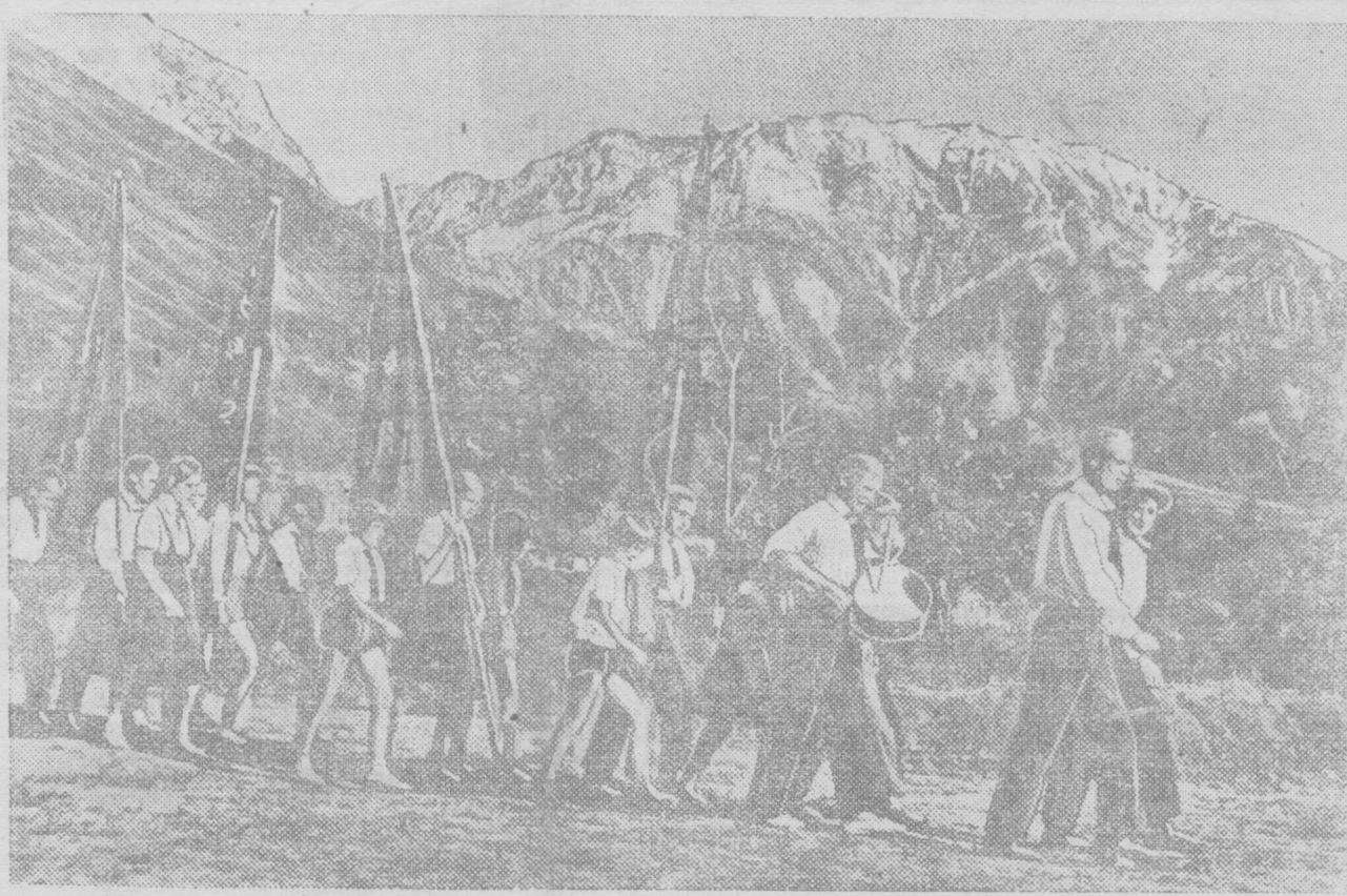
30 июня в Чимгане открыт пионерский лагерь САВО. НА СНИМКЕ: парад пионеров. Лагерь расположен в живописной долине Чимгана.

Секретарь Совета национальностей ЦИК СССР А. ХАЦЕВИЧ.