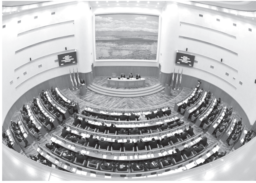
(Давоми. Бошланиш 1-бетда).

2015 йилда тижорат банклари томонидан иқтисодиётнинг реал секторига йўналтирилган кредитларнинг умумий ҳажми 27,3 фоиз ошди. Ички маблағлар ҳисобидан ажратилган кредитлар тижорат банклари кредит портфелининг умумий суммасида 86,7 фоизни ташкил этди, шундан 79,8 фоиз инвестиция мақсадларига ажратилган узоқ муддатли кредитлардир.