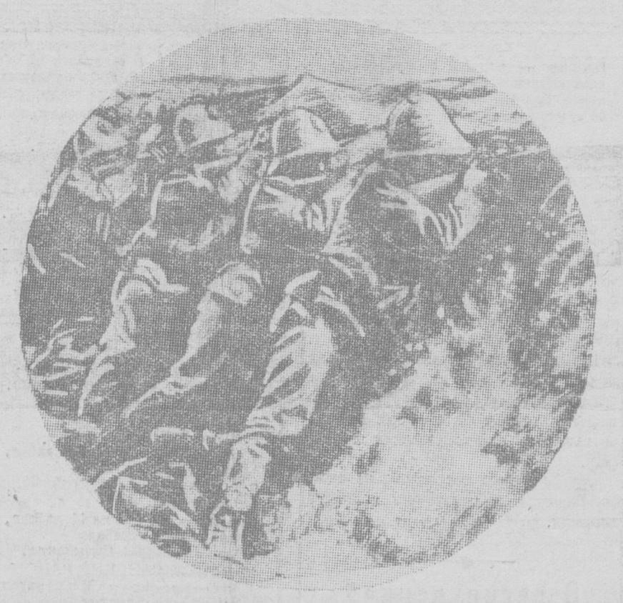
Северный фронт разрастался вдоль границы Абиссинии с итальянской колонией Эритрея. НА СНИМКЕ итальянская пехота на занятиях в учебных окопах в Эритрее.

Народный комиссар по иностранным делам тов. М. М. Литвинов вернулся в Москву из Женевы.