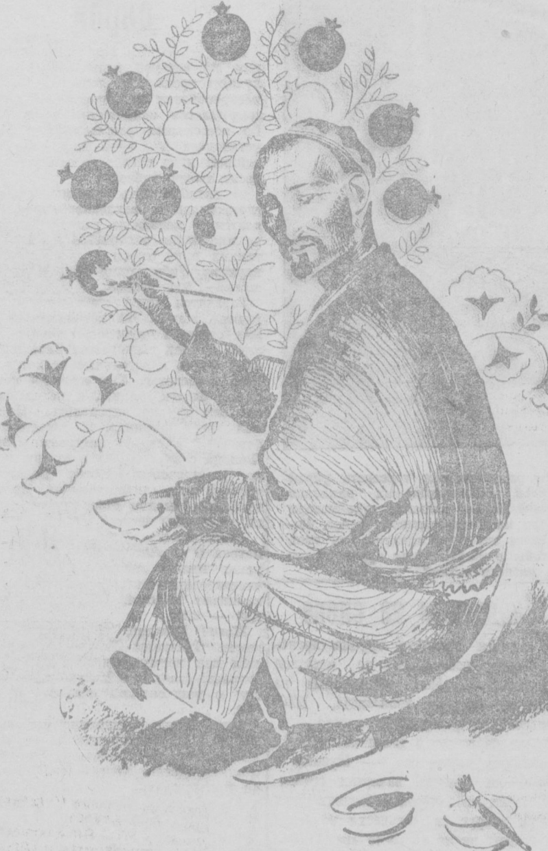
На рисунке Усто Мумина — Насретдин Шо-Хайдаров за работой.

Бригада слесарей по сборке кровельной, выполняющая санитарную программу на 120 процентов в первые две недели октября, довела свою производственную программу до 175 процентов.