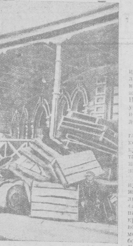
По распоряжению горсовета убранны прохладительные напитки...