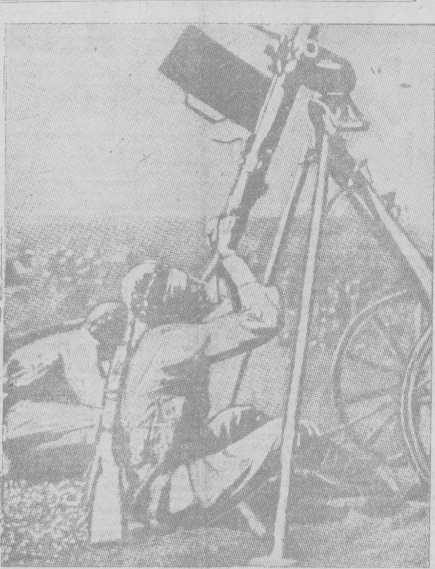
Стрельба по аэроплану из зенитных орудий абиссинскими солдатами.

ЛОНДОН, 29 (УзТАГ). Специальный корреспондент «Дейли телеграф» и «Джинтло» указывает, что наступление итальянцев на южном фронте ведется по трем направлениям, две колонны итальянских войск движутся вдоль двух параллельных рек. Третья колонна движется прямо через пустыни, примыкающую к границе Британского Сомали.