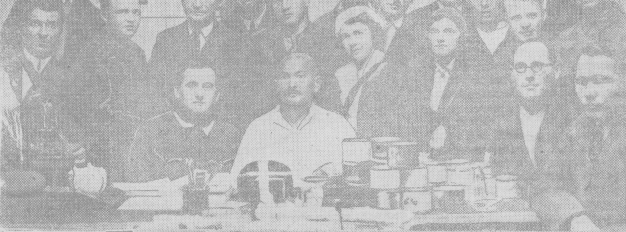
Пшеницы Узбекистана одержали крупную победу. Заводы Узбекского консервного производства...

Работники пищевой промышленности у тов. Цехера