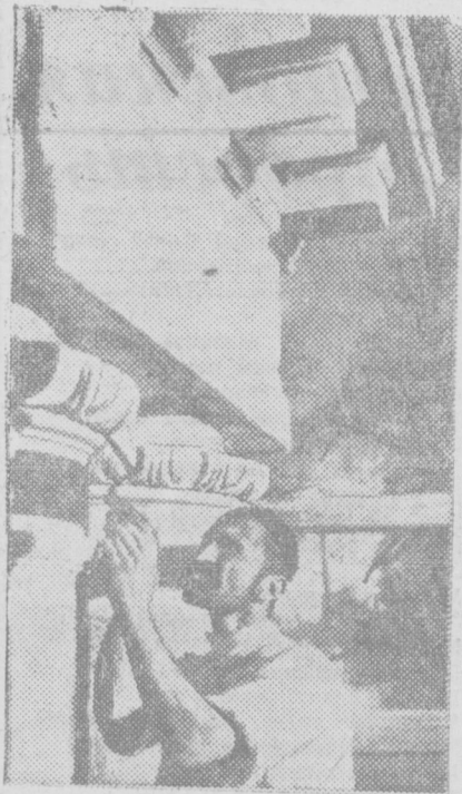
Замачивается строительство здания гразелебницы. НА СНИМКЕ: отделенной колонн.

СОВЕТА ПРОФСОЮЗОВ УЗБЕКИСТАНА о производстве работ в дни революционных праздников. 28 октября 1935 года г. Ташкент. В целях бесперебойной обслуживания населения в дни октябрьских торжеств президиум совета профессиональных союзов Узбекистана постановляет: