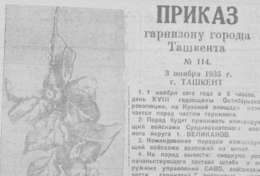
Уста-Уман — мастер музыкальных инструментов. Он делает новые восточные инструменты, отличающиеся чистым и сильным звуком...