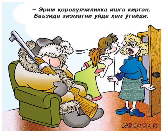
Эрим қоровулчиликка ишга кирган. Баъзида хизматни уйда ҳам ўтайди.