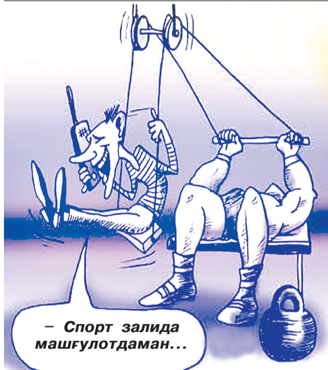
– Спорт залида машғулотдан... cartoon.kulichki.com