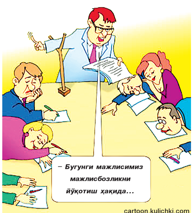
Бугунги мажлисимиз мажлисбозлиқни йўқотиш ҳақида...